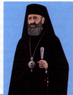
† IRINEU, Arhiepiscop al Alba Iuliei