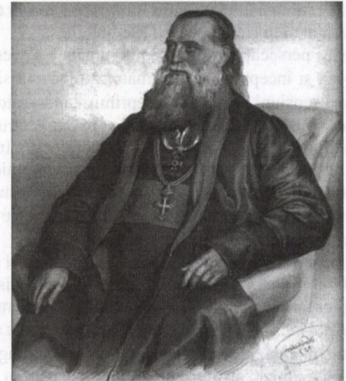
Episcopul Andrei Șaguna, Viena, 1857. Din Atelierul Curții imperiale din Viena, Kriehuber ciudat, deși sunt câștiguri de mult înscrise în legile deontologiei istoricilor, faptele sus-scrise trebuiau re-subliniate pentru că, fiind adeseori incomode pentru unii, existența, ca și lipsa lor, sunt în stare să strivească nu doar vieți, ci istoria însăși, lăsată pradă intereselor și sentimentelor.

Primul este unul pe care-l construiește istoricul scriind despre episcopul-lider al românilor pașoptiști și postpașoptiști, ANDREI ȘAGUNA . Din obligație pur profesională a cercetat extrem de numeroase documente în care personalitatea ierarhului Andrei ocupa un loc central, de mare anvergură în momente cruciale ale istoriei Europei, inclusiv controversate, de care nu se putea face însă nicum abstracție. Andrei Șaguna își înfăptuise marile lucrări în epoca ce-i era în responsabilitate profesională istoricului clujean Gelu Neamțu. În această ipostază – pe care n-o putem asimila cu o pasiune, pentru că abordările istorice nu se pot dezvolta pe terenul sentimentelor – și-a valorificat însă trăsături științifice fundamentale, creative, întâi fiind respectul față de adevărul înscris și cinstit interpretat . A investit o strădanie de excepție pentru a pătrunde sensuri noi ale unor date, pentru a le re-citi pe cele cunoscute, a le lansa în discuții pe cele necunoscute încă. Este știut – pe cât de regretabil este – că nu arareori pentru a spune și a susține adevărul, chiar bine documentat, este nevoie și de ...curaj, pe care el l-a avut. Oricât ar părea de