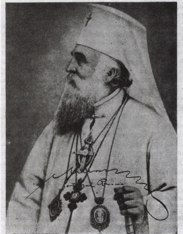
† I. P. S. S. MIRON PATRIARHUL ROMÂNIEI

Imediat după ziua Unirii, luni, 2 decembrie 1918, în sala tribunalului din Alba Iulia, s-au întrunit membrii Marelui Sfat Național pentru a desemna reprezentanții delegației ce avea să înmâneze regelui Ferdinand, la București, actul