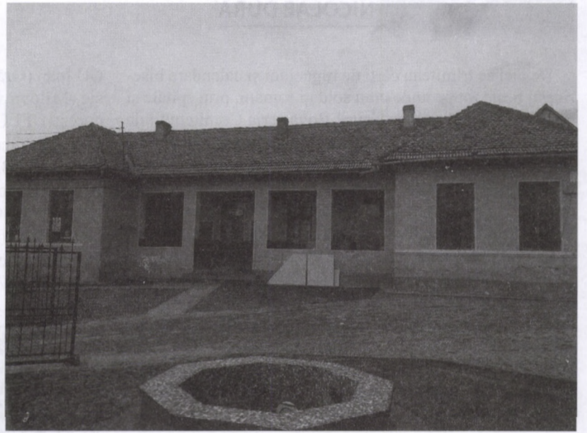
Fosta școală confesională, în stadiul actual

El a fost redactat de Ioan cavaler de Pușcariu fără niciun dubiu [A se vedea: „Telegraful Român”, nr. 12 din 12 martie 1860; Revista „Transilvania”, nr. 5-6, 1911, p. 662; Lupaș, op. cit. , p. 243; Ioan-Aurel Pop, op. cit. , p. 285-286; ÎPS Dr. Antonie Plămădeală, ASTRA – citorii și ctitoriile ei , Sibiu, 1987, p. 45; Idem, Pagini dintr-o arhivă inedită , Ed. Minerva, București, 1984, p. XIV-XVII], unde scria că neajunsurile poporului român în afirmarea sa în fața calvarului maghiar și săsesc se caracterizează prin totala „lipsă de reuniuni”, pe când „dacă am avea nu o academie ca a ungarilor din Pesta, ci numai o reuniune modestă