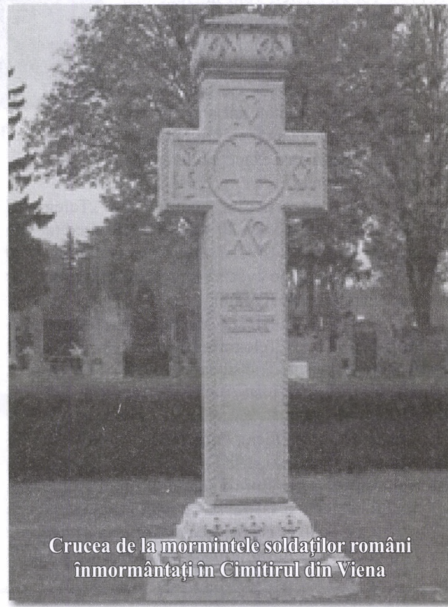
Crucea de la mormintele soldaților români înmormântați în Cimitirul din Viena