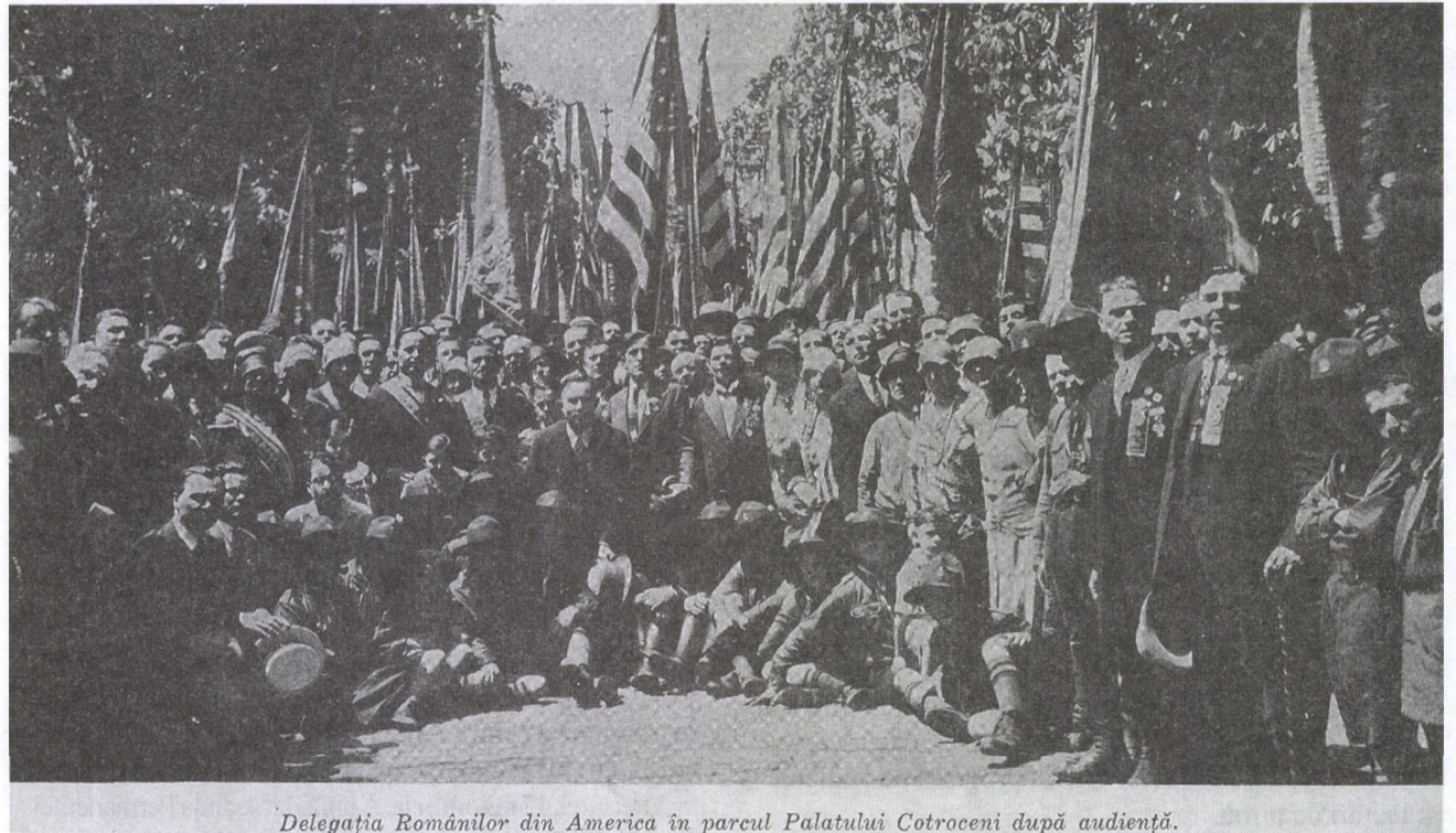
Delegația Românilor din America în parcul Palatului Cotroceni după audiență.