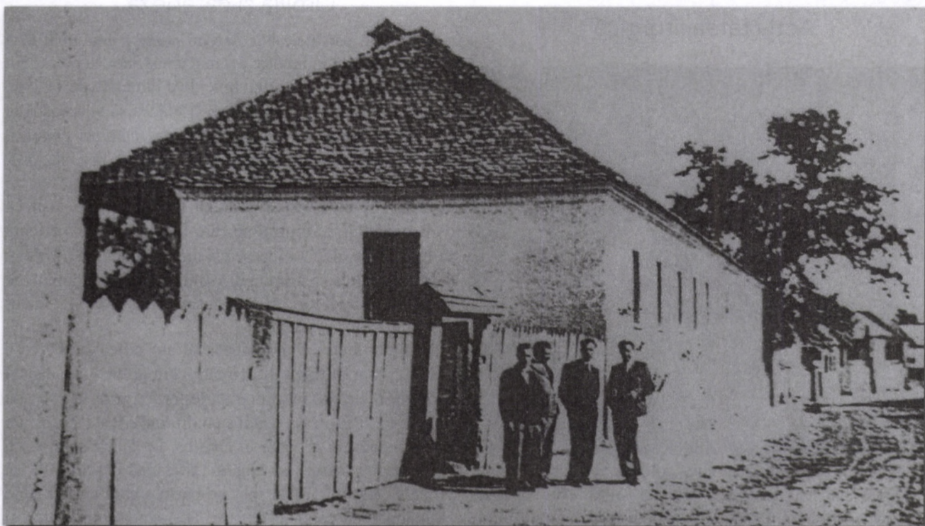
Fostul internat din Veneția de Jos

Studiu dedicat Marii Uniri de la 1 decembrie 1918 și făuritorilor ei (IV)