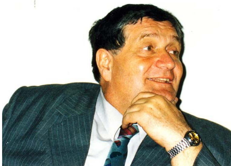
Alex Ștefănescu (1947)