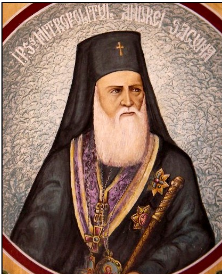
Andrei Șaguna 1809-1873