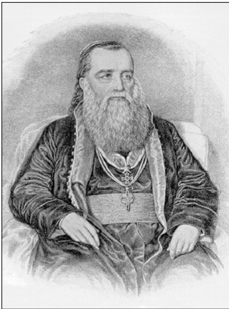
Andrei Şaguna 1809-1873