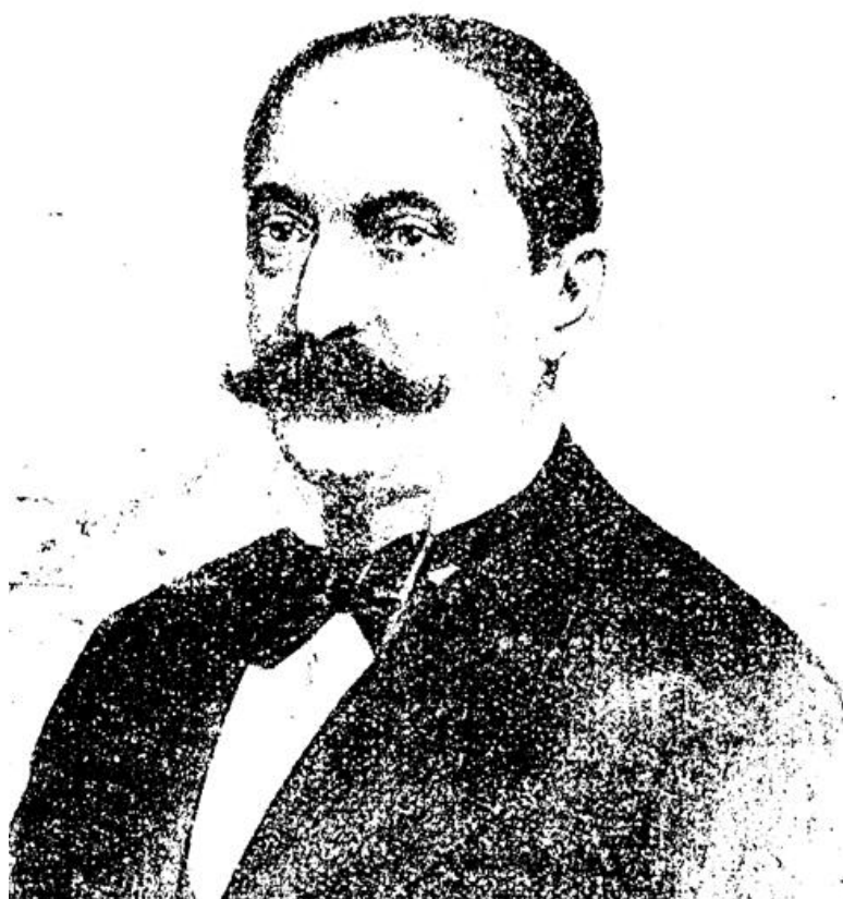
Andrei Bârseanu 1858-1922