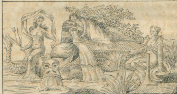
Nepia, Potamia, Naia.