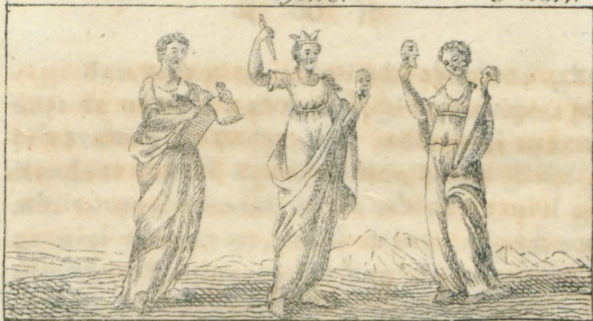
Ηλιο. Μελοποινα. Τηλια.