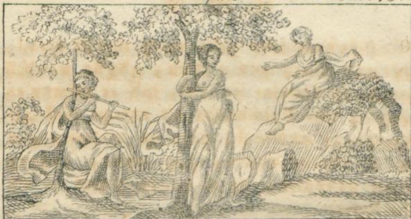
Dna, Auapia, Opa.