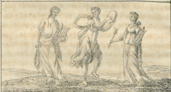
Εμπερπια, Τερπειχορα, Εραπο,