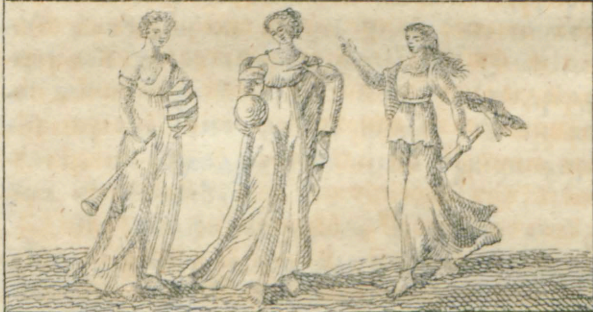
Κακιοπα, Ερανια, Πολιμιτια.