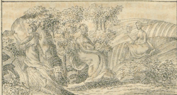
Napa, Atonia, Mhia.