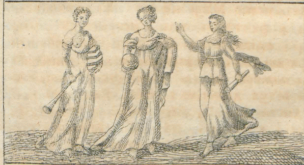
Κακίονα, Ερατία, Πολυμήνια.