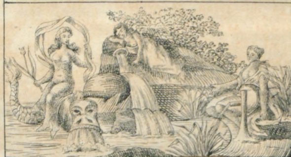
Νερσία , Ποταμία , Νάϊα .