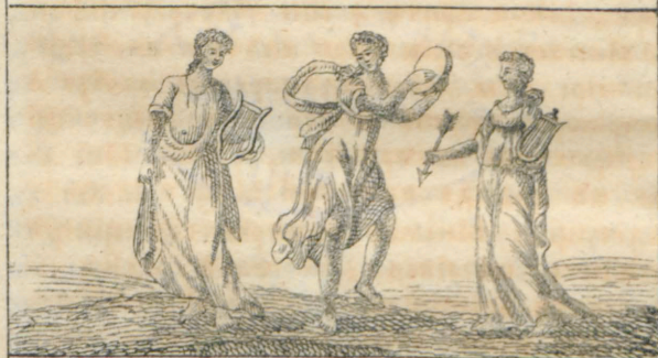
Εστέρνια, Τερψιχόρα. Ερατο,