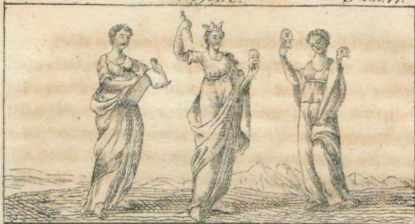
Κίλιο. Μελπομένη. Ταλία.