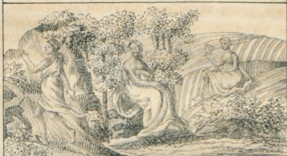
Ναπέα , Λετομία , Μελία .