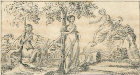
Δοία , Αμαδρία , Ορέα .