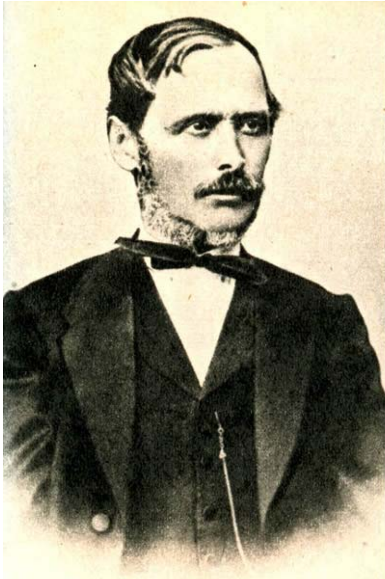
GEORGE BARITIU (1812-1893)