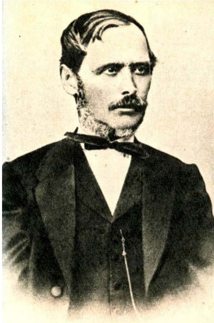
GEORGE BARIȚIU (1812-1893)