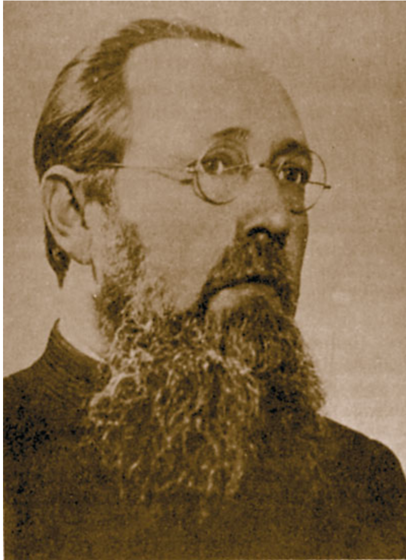
Ion Agârbiceanu (1882-1963)