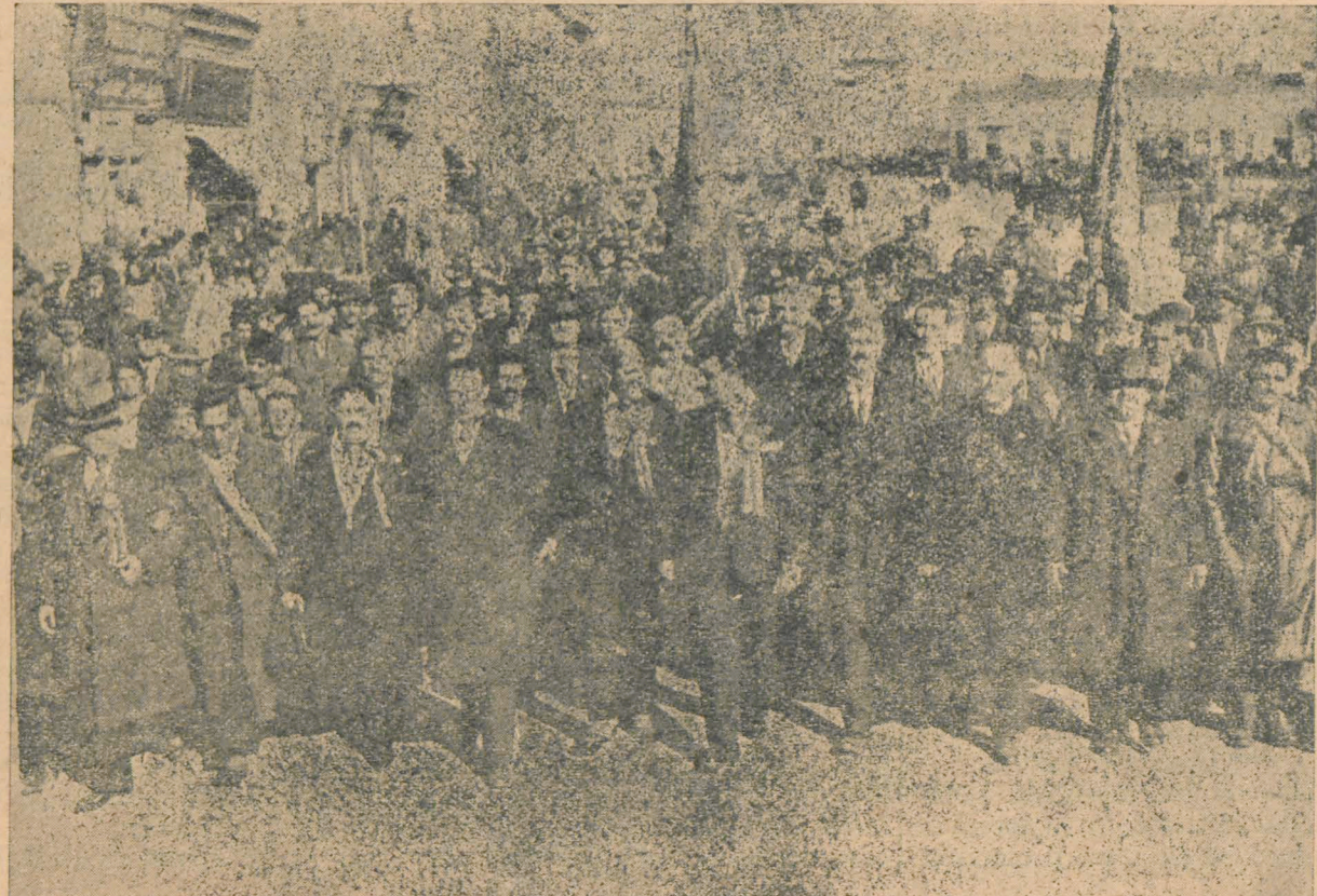
Cortegiul în drum spre Catedrală