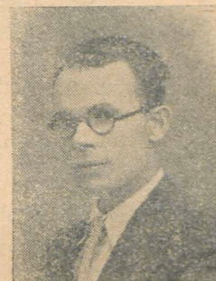
Av. I. Diaconu

Dacă aruncăm o privire retrospectivă, vom constata, că, din cele mai îndepărtate timpuri și până în prezent, una dintre problemele cele mai importante care au preocupat omenirea și în special pe conducătorii ei, a fost economia politică.