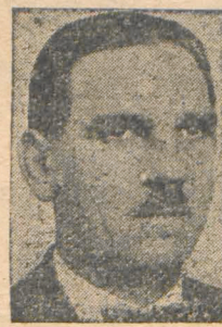
V. Stan-Bulgara Preşed. Sect. I Sect. II Negru