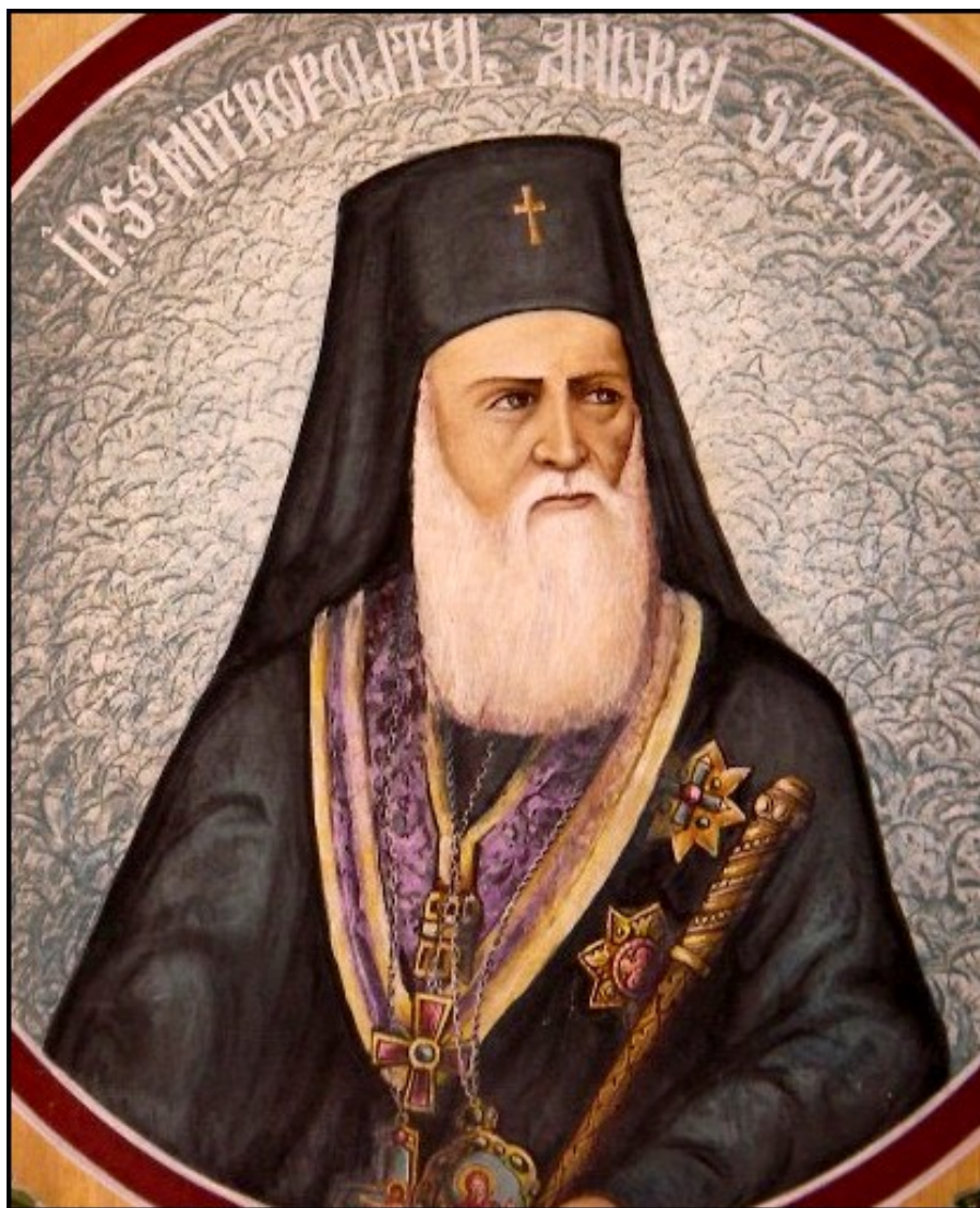
Andrei Șaguna 1809-1873