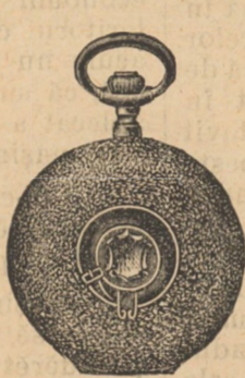
Nr. 4. Orologiu cil.-rem. de argint, 48 mm. diametru, cu capac dublu, în toc gravat frumos, sorte tari, I. fabricat în fl. 8.75.