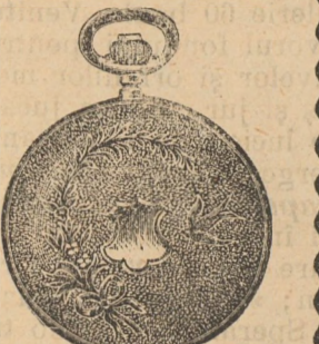
Nr. 2. Orologiu anker-remon. de argint, 50 mm. diametru, cu capac dublu, toc guiloșat ori gra- vat, 3 capace de argint, 5 rubine, sorte tari, I. fină „Transilvanien” 15 rubine, fl. 12.50.