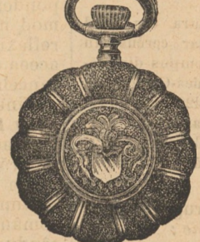
Nr. 6. Orologiu de dame, rem., de aur de 14 carate, 30 mm. dia- metru, capac dublu, I. calitate, guiloșat ori gravat fl. 25.—, în toc de argint fl. 11.50.