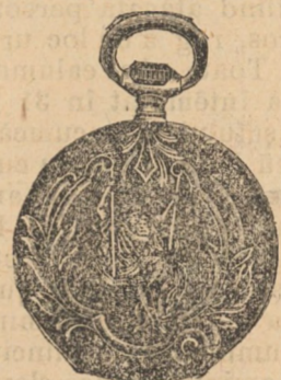
Nr. 5. Orologiu anker-remon. de argint, 50 mm. diametru, capac dublu, 3 capace de argint, 15 ru- bine, cu cerc de aur, fabricat în din sorte mai tari fl. 11.50, cu construcție cil.-rem. fl. 9.50.