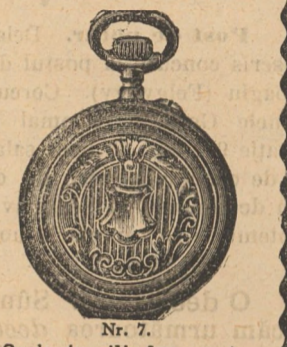
Nr. 7. Orologiu cilindru-rem. de argint, luciu ori gravat, în formă ovală, arătător de secunde, cu placă de cifre albă, emailată, I. calitate, fl. 4.50, cu capac dublu fl. 5.50. Lanțuri de mik- ke cu compas ori chieșă 30, 40, 50, 60 cr.