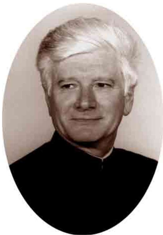
Mircea Păcurariu n. 1932