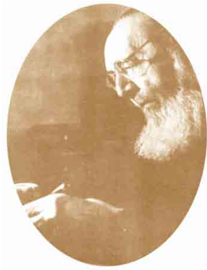
Ion Agârbiceanu 1882-1963