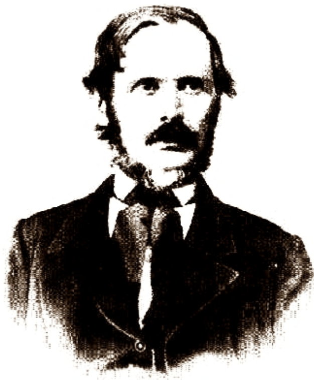
George Barițiu 1812-1893