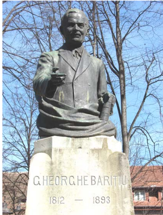
Monumentul lui Gheorghe Barițiu din Parcul ASTRA, Sibiu