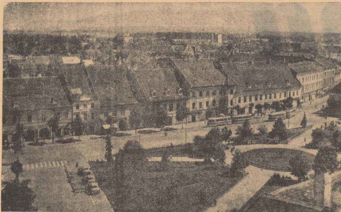
Piața Republicii din Sibiu, văzută din Turnul statului.

La complexul „Autoservire” din cartierul Gh. Gheorghiu-Dej există, în față, un afiș pe care scrie: „Achiziționăm sticle goale.”