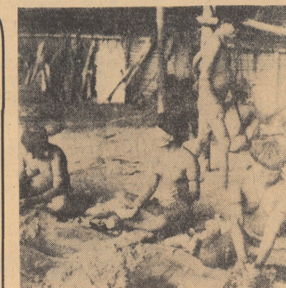
BRAZILIA — În inima acestui stat gigant sud-american, ca de altfel și în alte țări latino-americane, locuiesc triburi de indieni, pe cale de dispariție, datorită politicii de o cruzime greu imaginabilă dusă de cei care le rîvnesc pămînturile. Cercetările întreprinse au arătat că indienii brazilieni duc azi, în era atomică, o viață ca în paleolitic. Numărul lor scade vertiginos, fiind în bună parte exterminati chiar de salariații lui „Servicio de Proteção aos Indios”.

■ GUVERNUL REPUBLICII COSTA RICA A DECRETAT TREI ZILE DE DOLIU NAȚIONAL în memoria victimelor erupției vulcanului Arenal.