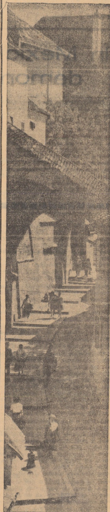
Din arhitectura Sibului de altădată: Pasajul scării.

Într-o clădire pusă la dispoziție de către consiliul popular comunal, prin investițiile acordate de către Direcția agricolă județeană, la Iacobeni a fost reamenajat și dotat cu instrumentarul necesar dispensarul veterinar. El asigură condiții corespunzătoare pentru aplicarea tratamentelor.