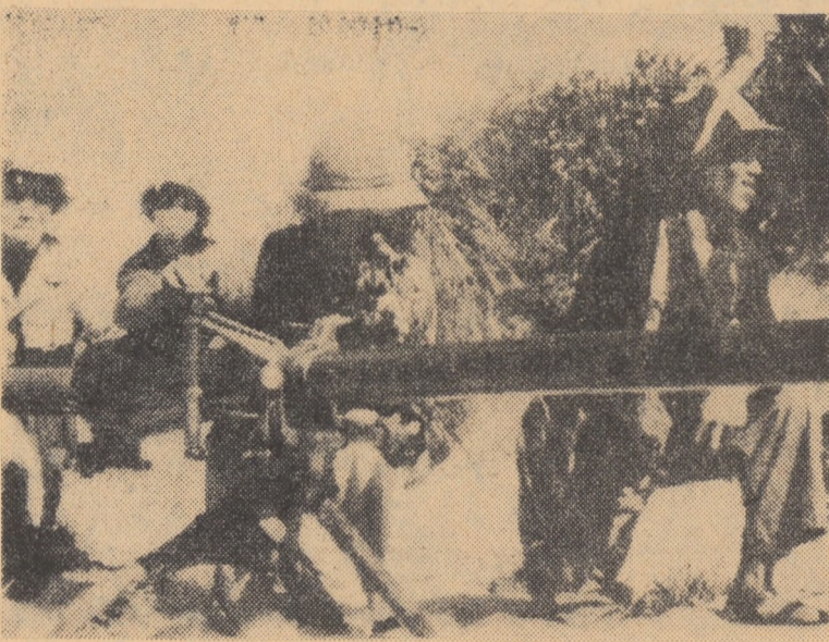
VIETNAMUL DE SUD — Pregătirea de către luptătorii forțelor patriotice a unei ambuscade pentru a lovi prin surprindere trupele americano-saigoneze. Mortierele sînt gata de luptă.

LA PAZ I (Agerpres). — Miercuri seara președintele Boliviei, Rene Barrientos, a rostit un discurs în care s-a referit la situația politică din țară, caracterizată de observatorii politici drept „foarte explozivă”. Președintele Barrientos a cerut populației rurale „să se înarmeze și să fie pregătită de a se înrola în armată” pentru a face față unei „iminențe” loviturii de stat. Discursul, considerat drept cel mai violent rostit vreodată de generalul Barrientos de la venirea sa la putere, a suscitât o anumită neliniște în cercurile politice. În ultimele zile în capitala țării au circulat zvonuri, potrivit cărora președintele Barrientos ar intenționa să dizolve parlamentul și să instaurze o dictatură militară. Cu puțin înainte ca Barrientos să-și începă discursul, câteva sute de studenți și muncitori au organizat miercuri seara în centrul capitalei boliviene o demonstrație. Garda națională a intervenit, efectuând numeroase arestări.