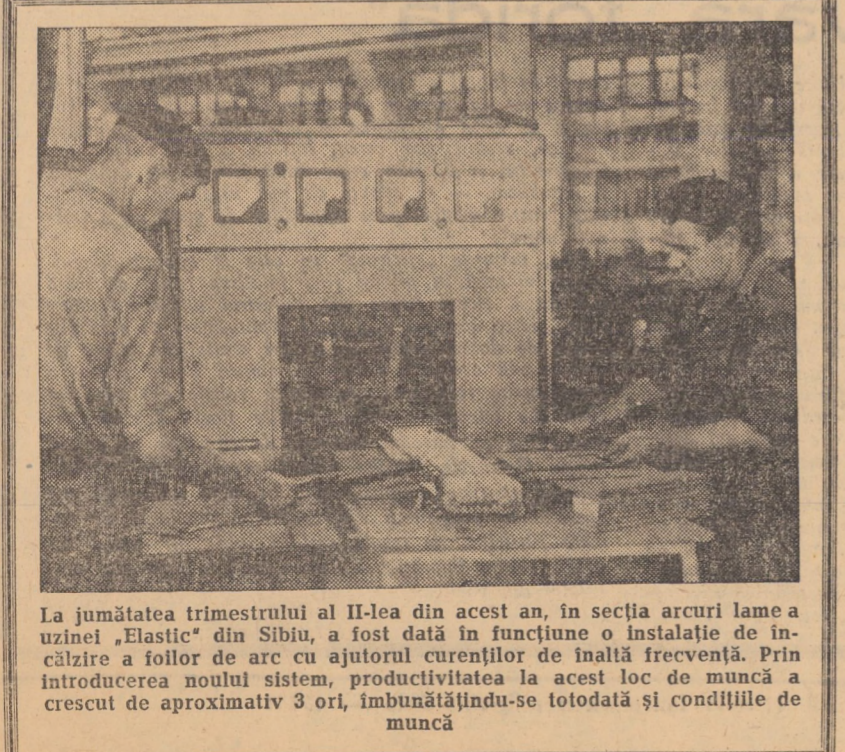
La jumătatea trimestrului al II-lea din acest an, în secția arcuiri lame a uzinei „Elastic” din Sibiu, a fost dată în funcțiune o instalație de încălzire a foliei de arc cu ajutorul curentului de înaltă frecvență. Prin introducerea noului sistem, productivitatea la acest loc de muncă a crescut de aproximativ 3 ori, îmbunătățindu-se totodată și condițiile de muncă