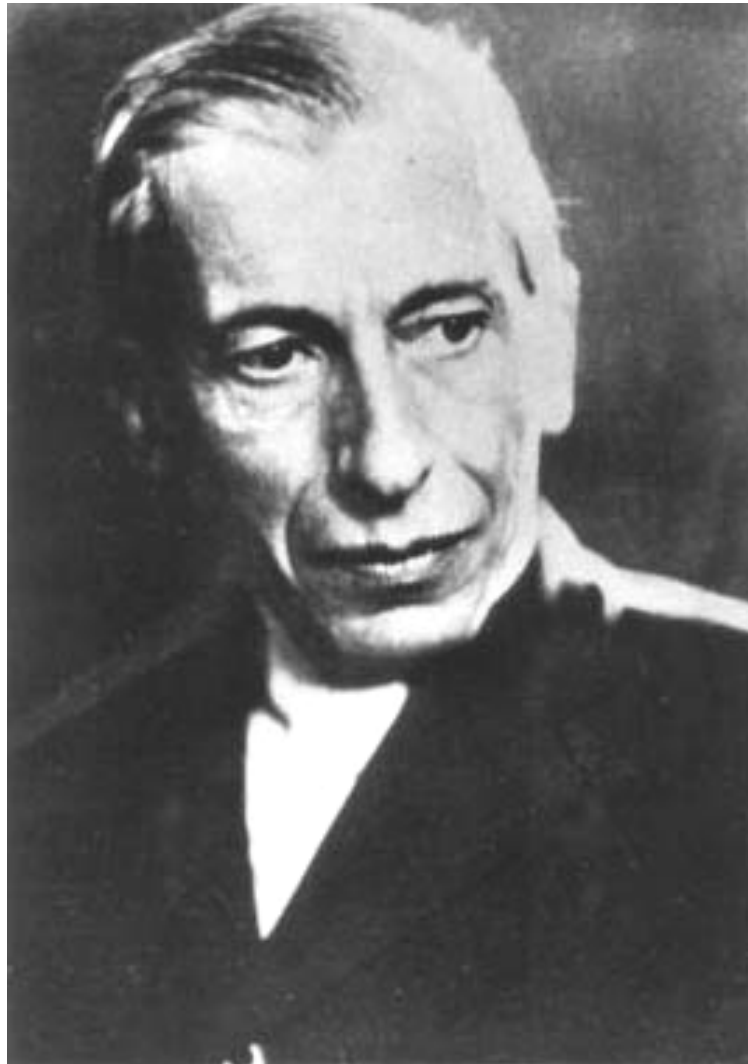
Nicolae C. Paulescu