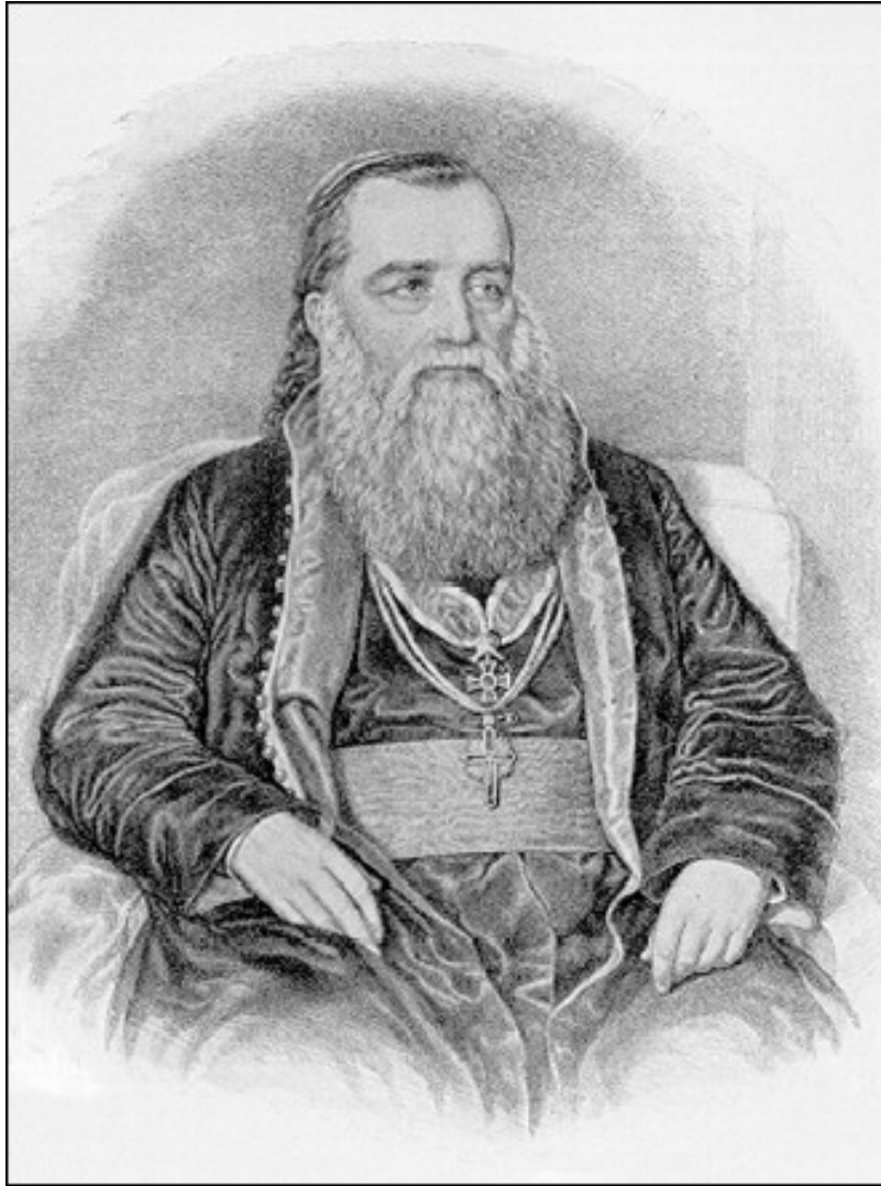
Andrei Şaguna 1809-1873