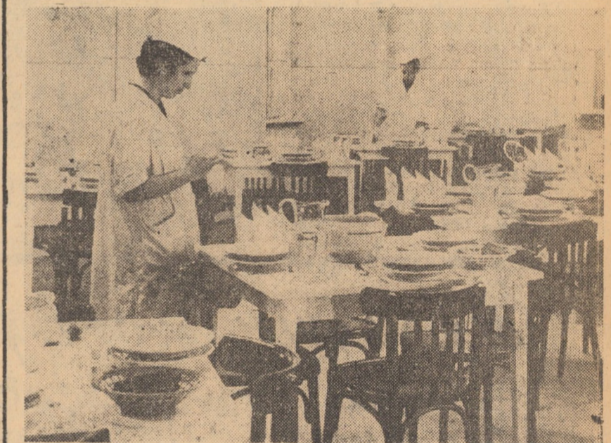
Cantina Căminului studentesc din Sibiu