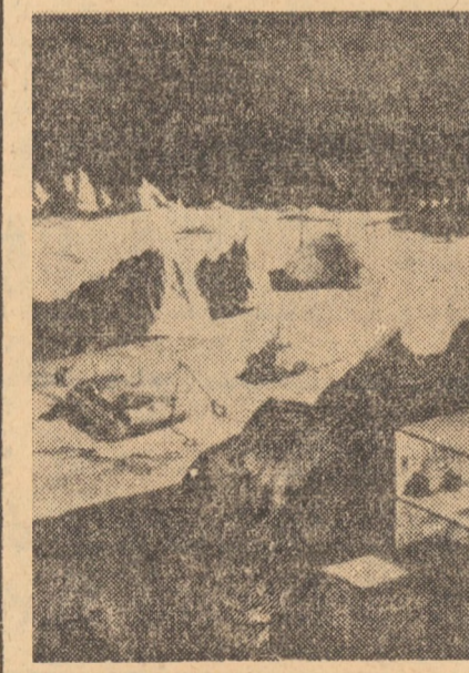
Etapa următoare prevăzută pentru anul 1975 prevede veritabile construcții subterane, baze permanente pe Lună, unde vor putea lucra între 25-50 de savanți, în laboratoare cu legături între ele

Roma 22 — Corespondentul Agerpres, N. Puicea, transmite: Secretarul național al Partidului Democrat-Creștin din Italia, Flaminio Piccoli, și-a anunțat demisia ca urmare a dizolvării curentului majoritar „angajamentul democratic”, care a condus timp de 10 ani partidul. Dizolvarea acestui curent — una din cele nouă grupări existente în P.D.C. — a survenit în urma divergențelor ivite între liderii săi — Piccoli, Rumor, actualul prim-ministru, Colombo și Andreotti — privind soluția ce ar urma să fie adoptată pentru reconstituirea coaliției guvernamentale de centru-stînga.