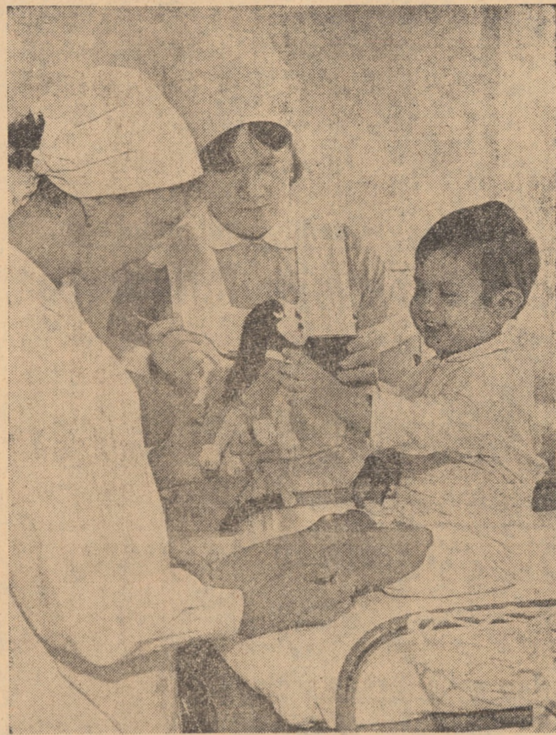
Mai întîi povestea cu Grivei, apoi picăturile lui nenea doctor... Secvență cotidiană din secția pediatrie a Spitalului Unificat Agnita