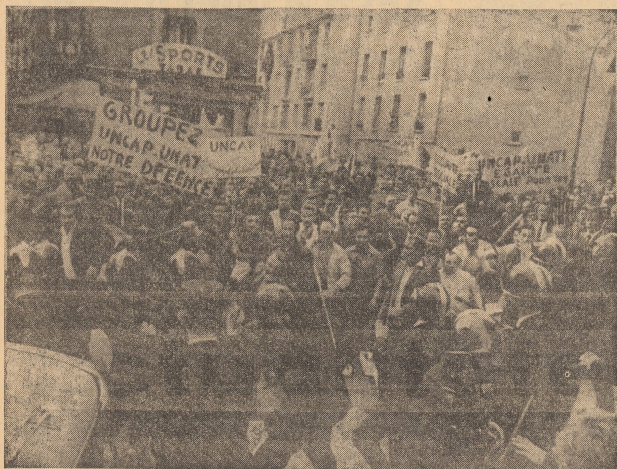
FRANȚA. La Paris în „Parc des Princes” a avut loc o manifestație a comercianților și meseriașilor pentru securitate socială. Poliția a intervenit cu brutalitate, precum se vede în fotografie