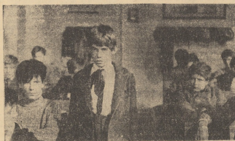
Cadru din filmul Băieții din strada Pal

ANGAJEAZĂ PRIN CONCURS: — un șef serviciu financiar. CONDIȚII: — studii economice superioare — vechime în funcții economice superioare: 9 ani. MICA PUBLICITATE Vînd motocicletă B.M.W. 250 cm c cu atate, stare perfectă. Sibiu, str. 11 Iunie 8, apartament 5, orele 15-17. Vînd Renault 16 alb, tip 1967, stare perfectă. Tg. Mureș, telefon 156 79. Cumpăr motor FIAT 600, stare perfectă. Sibiu, str. Hurmuzachi 9.