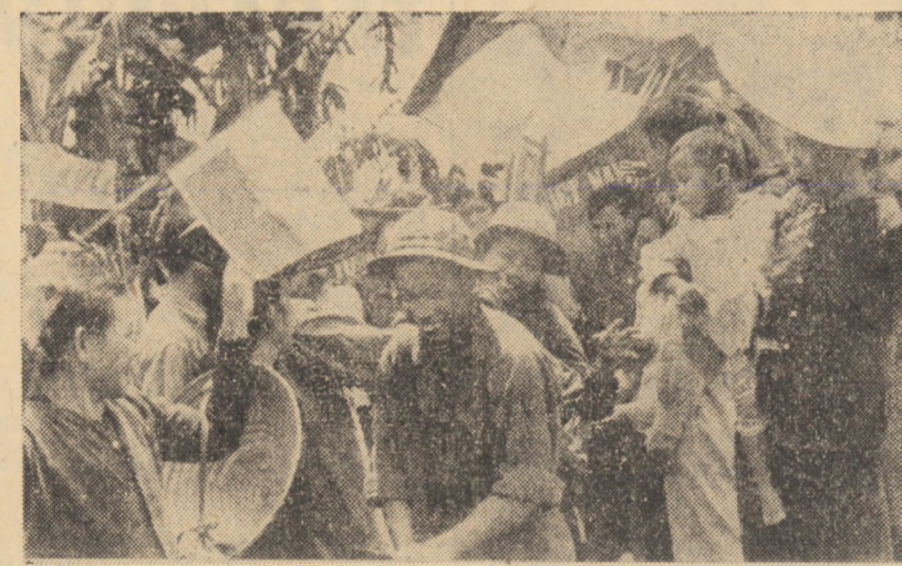
VIETNAMUL DE SUD. După lupte crîncene, o parte a teritoriului Vietnamului de sud a fost eliberat de către forțele patriotice. În foto: populația din zonele eliberate Quang Tri-Thua, face o călduroasă primire soldaților F.N.L. Parte din aceștia sînt soții și fiii lor

WASHINGTON 3 (Agerpres). — Populația Statelor Unite ale Americii a atins la 1 septembrie a.c. 200 263 721 locuitori, anunță biroul american de recensămint. Statisticile relevă totodată un fapt inedit pe harta demografică a S.U.A. pentru prima dată în istoria acestei țări, afluaul de populație spre principalele orașe a fost contrabalansat de plecările spre alte localități mai puțin populate, în general situate pe coastele Atlanticului și Pacificului. 13 din cele 25 de orașe principale au în prezent o populație mai mică decit în 1960. Chiar New Yorkul, care rămîne cel mai populat oraș din S.U.A. (7 771 730 locuitori), are în prezent cu cîteva mii de locuitori mai puțin decit în 1960, iar al doilea mare oraș din S.U.A., Chicago (3 325 263) a pierdut 250 000 de rezidenți. Ca urmare a acestor mutații, statul California a preluat locul statului New York ca cel mai populat din S.U.A. Schimbările produse în anii '60 în repartizarea populației pe teritoriul S.U.A. se vor reflecta și pe planul reprezentării în Congres. Astfel, șase state vor obține mai multe locuri în Camera Reprezentanților decit pînă acum, în timp ce alte 10 state vor avea un număr mai restrîns de locuri.