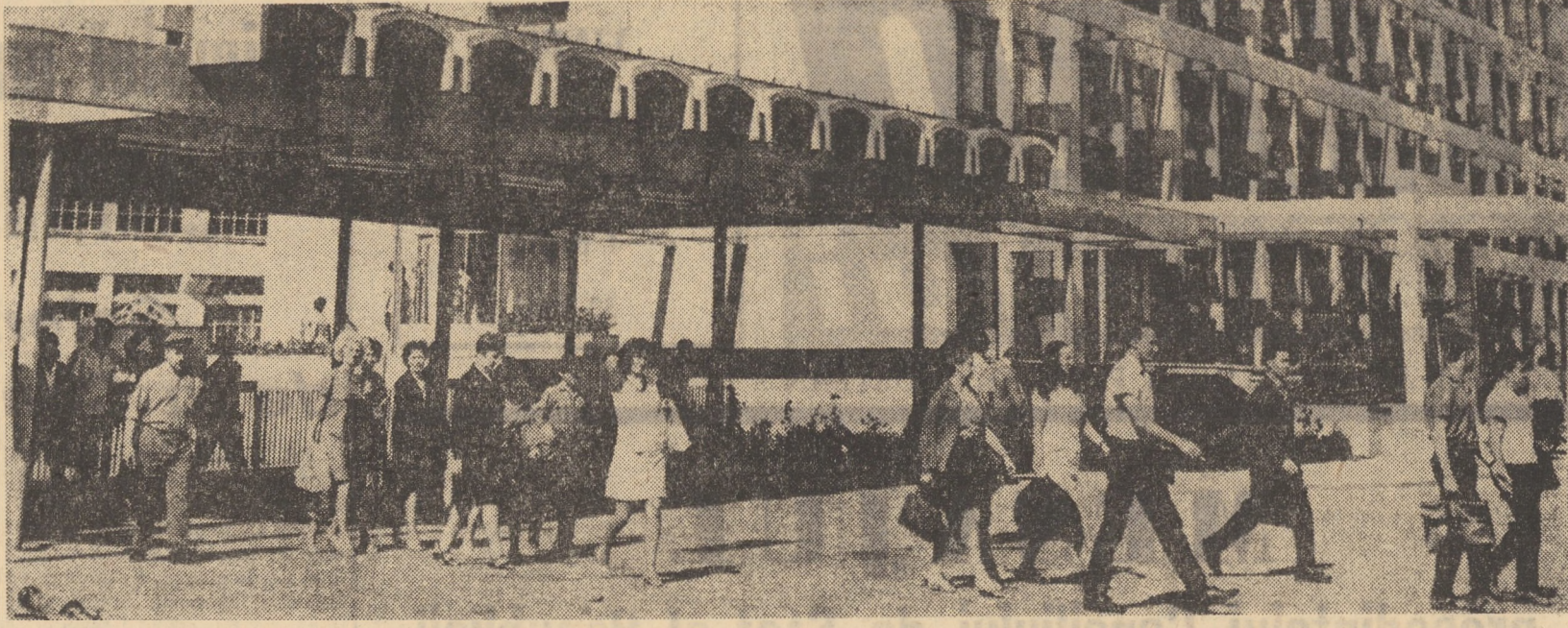
Sfîrșit de schimb la uzina „Independența” Sibiu

Cu câteva zile în urmă autosalvarea dispensarului uman din Nocrich a fost solicitată urgent de medicul din Marpod pentru a transporta la spital doi copii (teșimfectie alimentară). Seful barman la spital de promptitudine comenzi. Dar la țesirea din comuna Marpod, mașini i s-a rupt bara de direcție. Și copiii au fost transportați la spital cu o mașină a cooperativei de consum din Nocrich. Ce s-a întâmplat cu autosalvarea? A rămas acolo în marginea drumului mai bine de două zile. Seful a fost chemat la Agnita și pus să lucreze pe altă mașină. A fost nevoie de „interventie” pentru ca mașina salvării să fie adusă în stîrșit în atelierul mecanic din Nocrich pentru reparare. Ce se întâmplă oare dacă, în acest interval de timp, era nevoie urgent de autosalvare în unul din cele 14 sate deservite de dispensarul din Nocrich? Se apela la Sibiu sau la Agnita? În acest caz, puteau oare cei din Sibiu sau Agnita răspunde tot așa de prompt și de repede? Cu siguranță că nu. Iată de ce tinerea autosalvării dispensarului din Nocrich defectă mai multe zile nu e numai o neglijență ci și o lipsă de responsabilitate care se cere sancționată. Așteptăm... vestii AL. SOMEȘANU