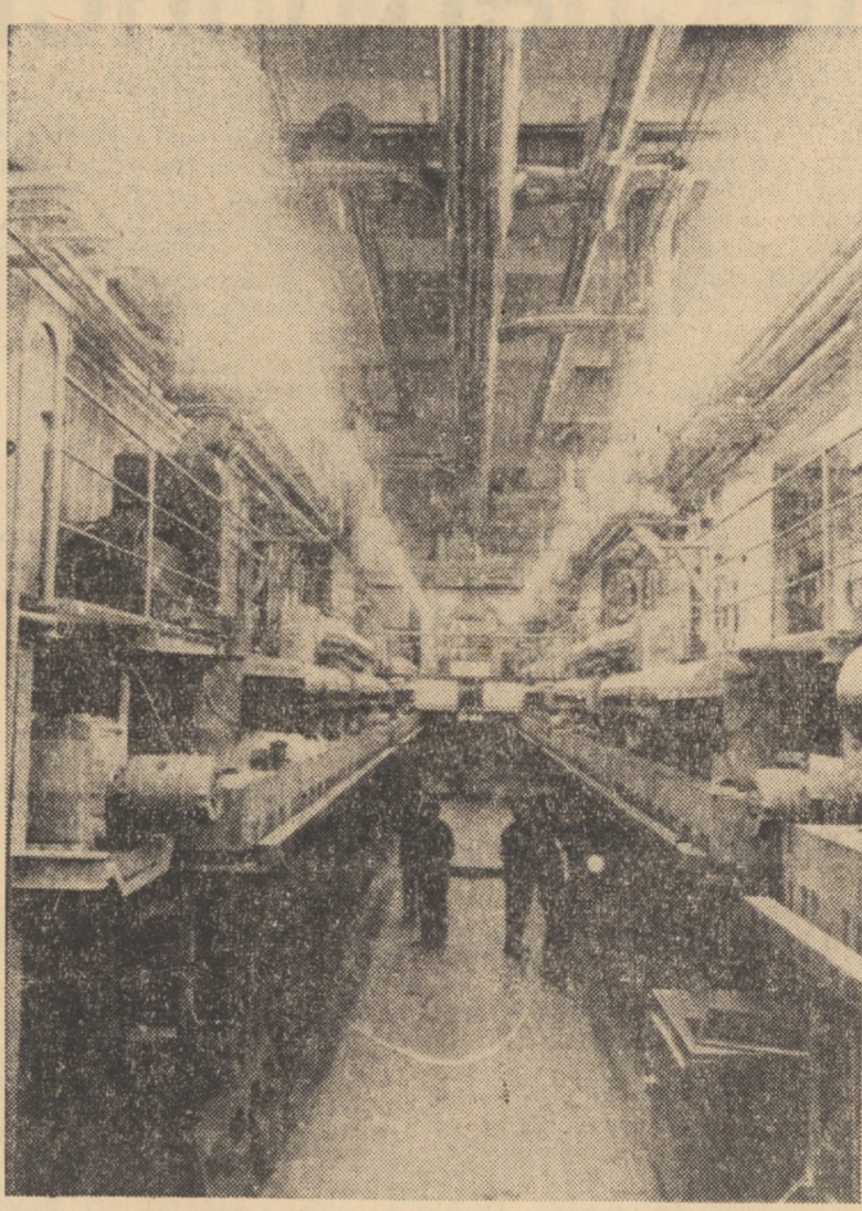
R.S. CEHOSLOVACIA. Recent la fabrica „Slovensky Hodvab” din Senica, Slovacia de Vest au fost produse primele cantități de mătase din fibre poliesterice purtînd denumirea locală de „Slotera”. Amestecate cu lînă, aceste fibre de mătase dobîndesc surprinzătoare calitate la curățire, spălare și o mare rezistență la purtare. După producția de încercare se presupune o producție medie anuală de 3 000 tone de mătase poliesterică, urmînd ca pe viitor cantitatea să fie dublată. În foto: una din secțiile de fabricare a mătasei din fibre poliesterice la fabrica din Senica

Belgrad 3 — Corespondentul Agerpres, George Ionescu, transmite: Convorbirile oficiale purtate la Belgrad de șeful guvernului turc, Suleyman Demirel și șeful guvernului iugoslav, Mita Ribicici, s-au referit la unele aspecte ale colaborării bilaterale, precum și la actualele probleme ale vieții internaționale. Aprecind că relațiile dintre Turcia și Iugoslavia se dezvoltă favorabil, cei doi premieri și-au exprimat dorința ca această colaborare să continue și în viitor și să se dezvolte în toate domeniile. Ei și-au exprimat acordul pentru înființarea unei comisii mixte de colaborare economică. În cursul schimbului de păreri, s-a constatat că Iugoslavia și Turcia au puncte de vedere identice sau apropiate în aprecierea situației din lume și în legătură cu o serie de probleme internaționale actuale. Subliniind că toate popoarele lumii doresc astăzi să trăiască în bunăstare, năzud în consecință spre consolidarea păcii, Demirel a relevat că Turcia se pronunță pentru relații de bună vecinătate, pentru pace și pentru rezolvarea problemelor litigioase pe calea tratativelor, pe baza respectării independenței, suveranității și integrității fiecărei țări. Exprimându-și acordul cu o asemenea apreciere a evoluției internaționale, premierul iugoslav a subliniat la rîndul său că securitatea în Europa reprezintă un factor foarte însemnat pentru pace în întreaga lume, care necesită eforturi din partea tuturor țărilor continentului nostru.