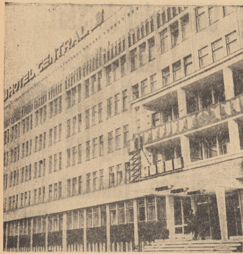
Impunătoarea construcție a noului hotel „Central” din municipiul Mediaș.