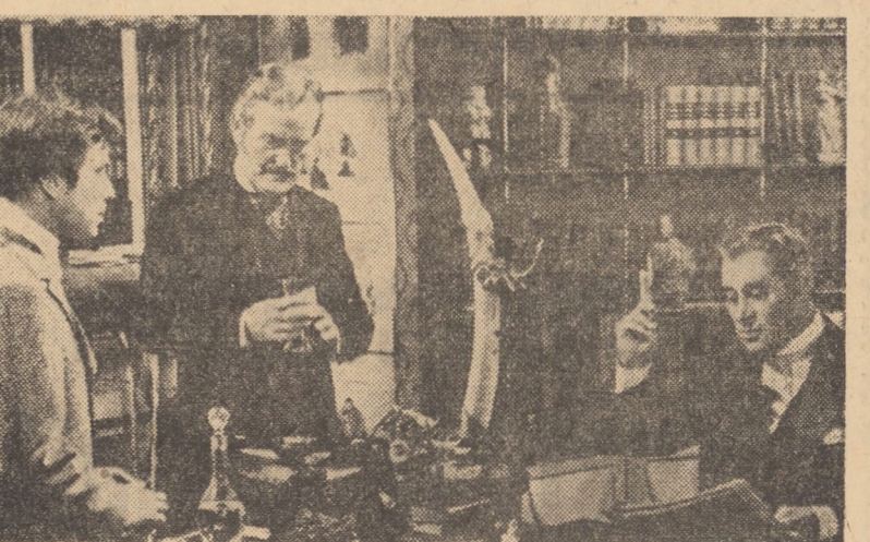
Cadru din filmul „Bănuiala”, care rulează la cinematograful din Bazna-Băi

Cercul cehoslovac „Humberto” prezintă spectacole în orașul nostru, azi, la orele 16,00 și 20,00.