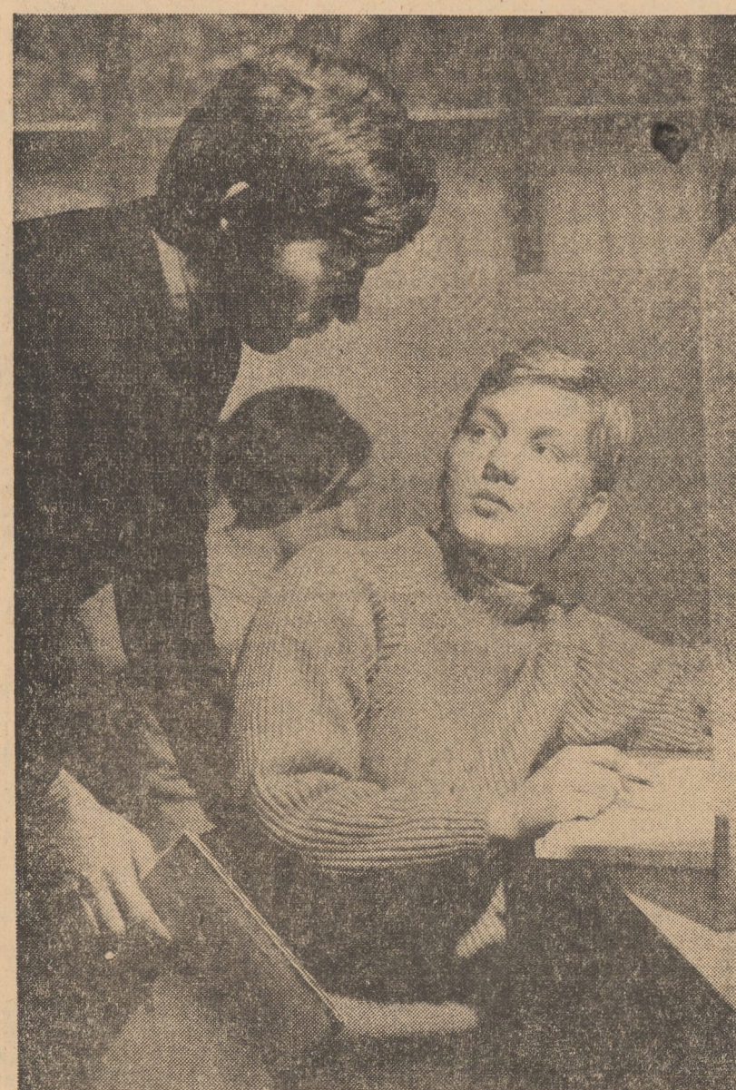
Secvență din sala de lectură a Facultății de filologie-istorie Sibiu