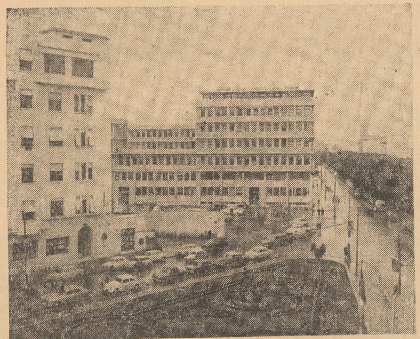
TUNISIA. Pe ruinele vechiului stat cartaginez, distrus și transformat în provincie romană în anul 146 î.e.n. ocupat apoi de arabi și mai târziu de francezi, s-a creat statul tunisian, devenit independent în 1956 și proclamat republică în 1957. Stat cu o economie avansată în comparație cu alte state africane, cu vederi largi, politice, Tunisia întreține relații de prietenie cu multe țări ale lumii printre care și țara noastră. În fotografie: vedere din Tunis, capitala țării

Referindu-se la votul de încredere obținut de guvern, observatorii relevă faptul că acesta reflectă o creștere a autorității cabinetului prezidat de Chaban-Delmas. France Presse arată, între altele, că în raport cu rezultatele votului la prima declarație de politică generală a actualului guvern, prezentată în Parlament în septembrie 1969, cabinetul francez a obținut joi noaptea un plus de 13 voturi.