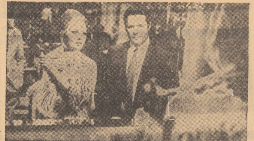
Cadru din filmul Un loc pentru îndrăgostiții