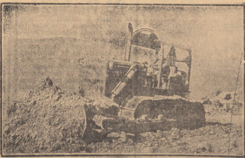
Unul din modernele utilaje ale Uzinei de tractoare Brașov, la cotele cele mai înalte ale Transfăgărășanului. Constructorii de pe șantierele mari magistrale rutiere au adresat, acesteia, colectivului de muncă al cunoscutului uzine de la poalele Timpel, o scrisoare de mulțumire prin care elogiază performanțele tehnice remarcabile ale acestui utilaj