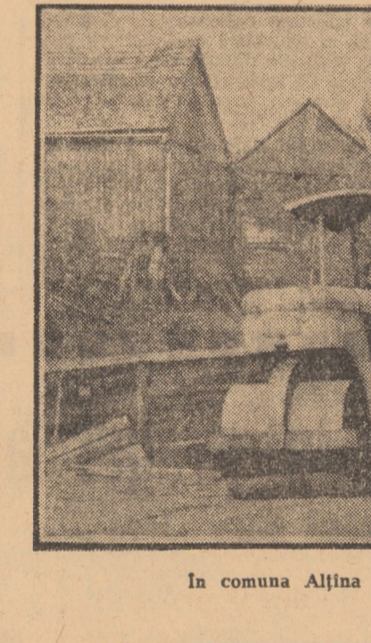
În comuna Alțina se asfaltează ultimele porțiuni ale șoselei Sibiu-Agnita