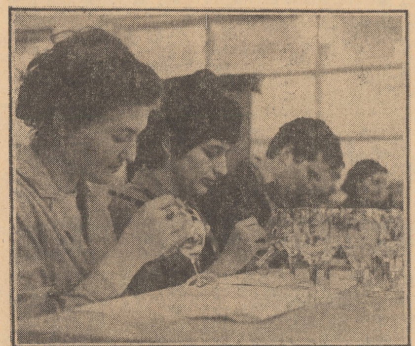
Se aplică decorul pe articolele fine de menaj din sticlă, la fabrica „Virtometan” Medias

■ Întreprinderile și organizațiile economice din județul Bihor au aplicat, în perioada ce s-a scurs din acest an, peste 270 de măsuri tehnico-organizatorice, avînd ca scop creșterea eficienței activității lor. Acestea au determinat micșorarea cheltuielilor de producție cu 11,5 milioane lei, sporirea productivității muncii, pe ansamblul industriei județului cu 1,7 la sută peste prevederile planului. În prezent, sînt în curs de finalizare alte 160 măsuri tehnico-organizatorice, care vor permite o reducere a cheltuielilor de producție, pînă la sfîrșitul anului, la nivelul economiei județului cu peste 26,5 milioane lei. (Agorpres)