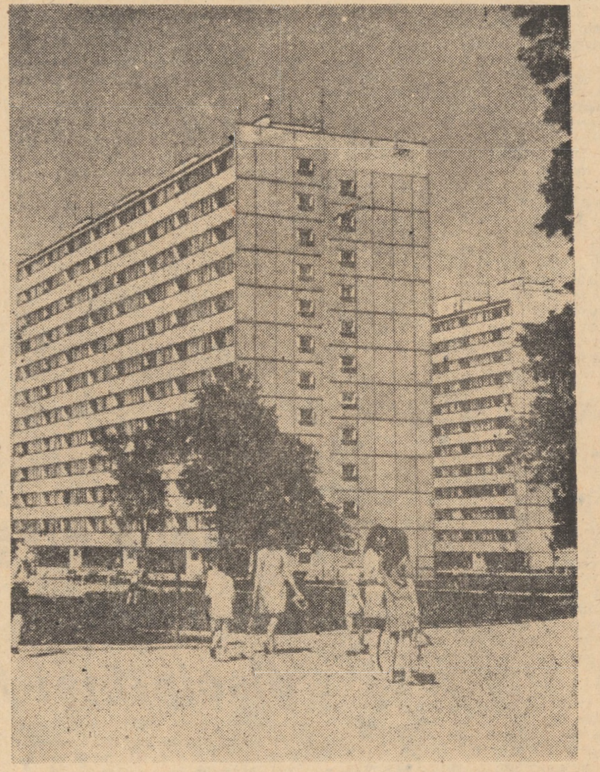
In anii puterii populare în R.P. Polonă s-au construit o serie de cartiere noi. Cartier nou de locuințe la Wrocław-Gajowice

Havana 13 (Agerpres). — Muncitorii din industria materialelor de construcție a Cubei și-au îndeplinit