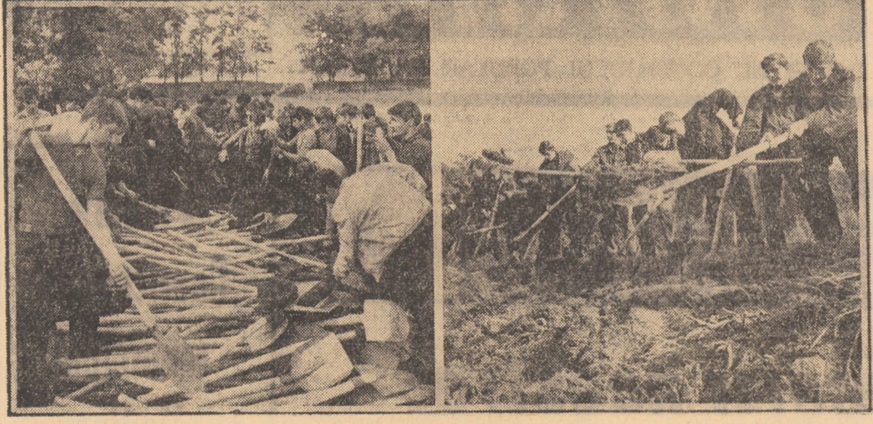
Impărțirea uneltelor (stinga) și în plin lucru (dreapta) — două imagini cotidiene de pe șantierul de muncă patriotică al tineretului „Valea aurie” Sibiu, unde, zi de zi, se întrec elevii mai multor școli, lucrând la amenajarea unui irmos complex sportiv