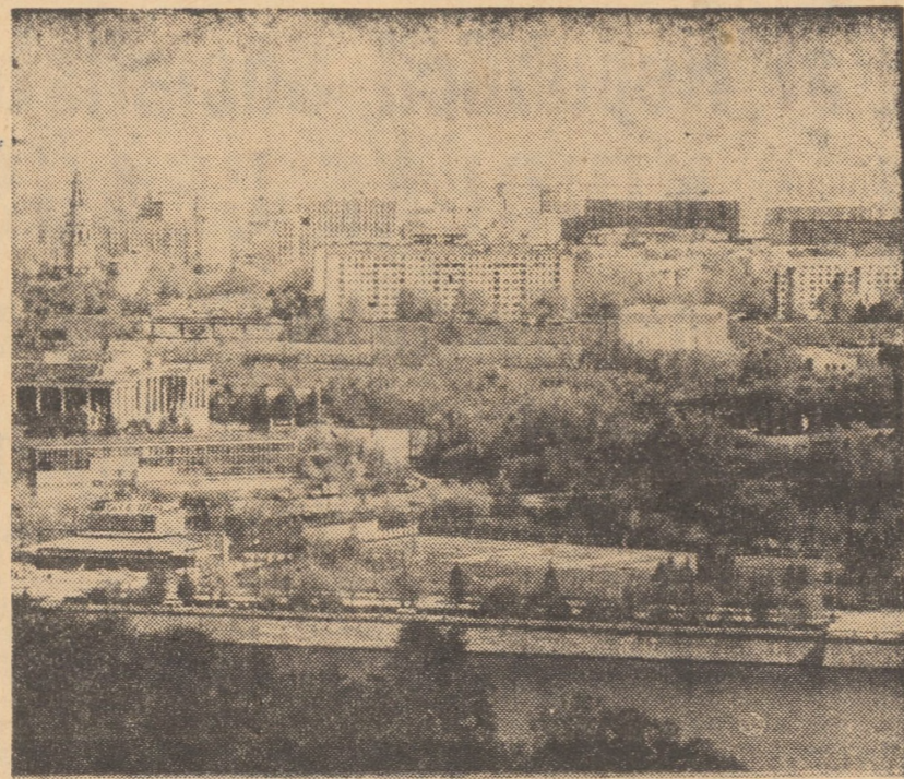
U.R.S.S. — În foto: Vedere a Moscovei de pe Colinele lui Lenin

Referindu-se la politica externă a țării sale, Bohuslav Chnoupek a evidențiat că R.S. Cehoslovacă este deosebit de interesată în evoluția pozitivă a evenimentelor din Europa. Cehoslovacia ar dori să-și reglementeze relațiile cu Austria și să obțină normalizarea relațiilor cu Republica Federală a Germaniei, a declarat el. Conducătorii partidului și guvernului R.S.C. au relevat, în mai multe rînduri, că sint gata pentru o reglementare cu R.F.G. pe calea semnării unui tratat, în condițiile recunoașterii acordului de la München ca nevalabil de la început. B. Chnoupek a dat o apreciere pozitivă politicii internaționale realizate a guvernului Brandt și și-a exprimat speranța că ea se va manifesta și în rezolvarea problemei privind reglementarea relațiilor dintre R.F.G. și R.S.C.