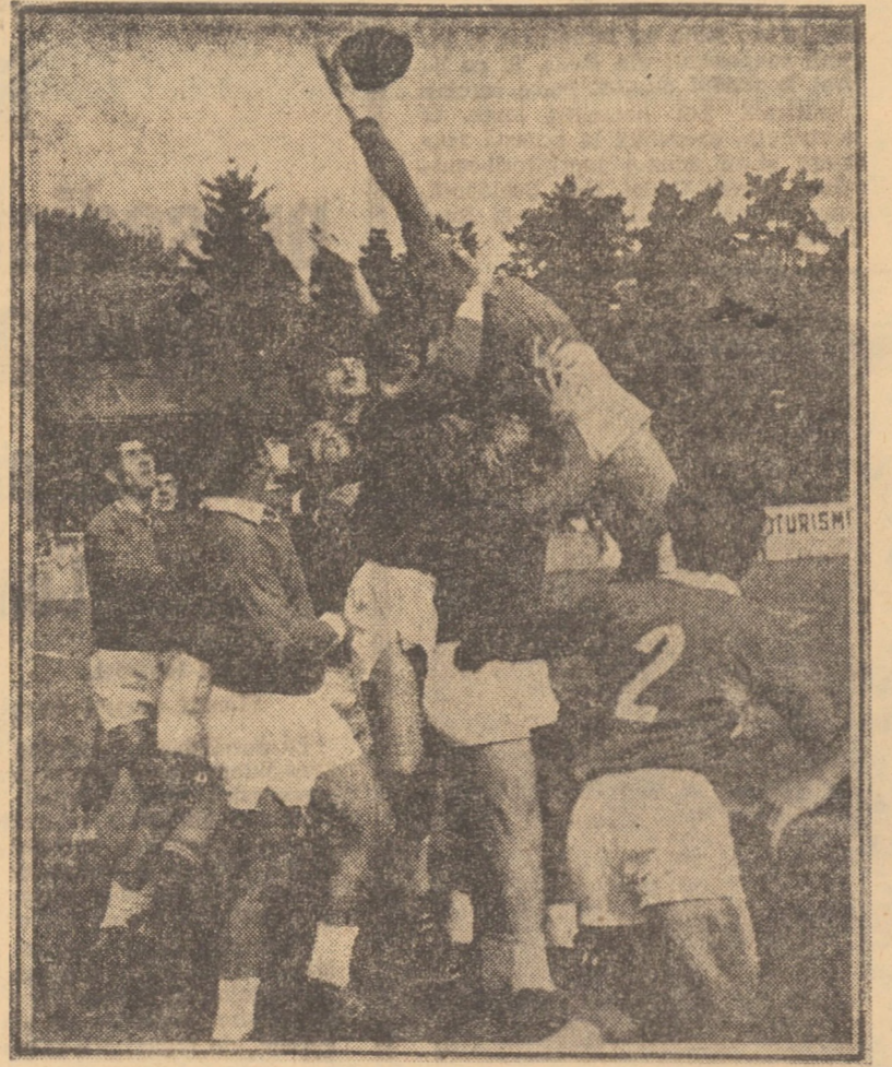
Iată o fază care probează frumusețea unui sport bărbătesc prin excelență, cum este rugby-ul. Faza din meciul C.S.M. Sibiu - Politehnica Iași (15-0)