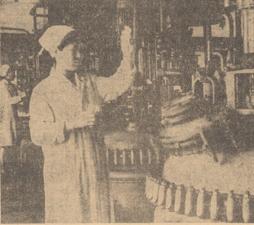
R.P.D. COREEANĂ. În foto: Imagine din una dintre secțiile Fabricii de medicamente din capitala R.P.D. Coreene — Phenian.

STUDENT, caut camera nemobilă sau semimobilă, central. Telefon 14167.