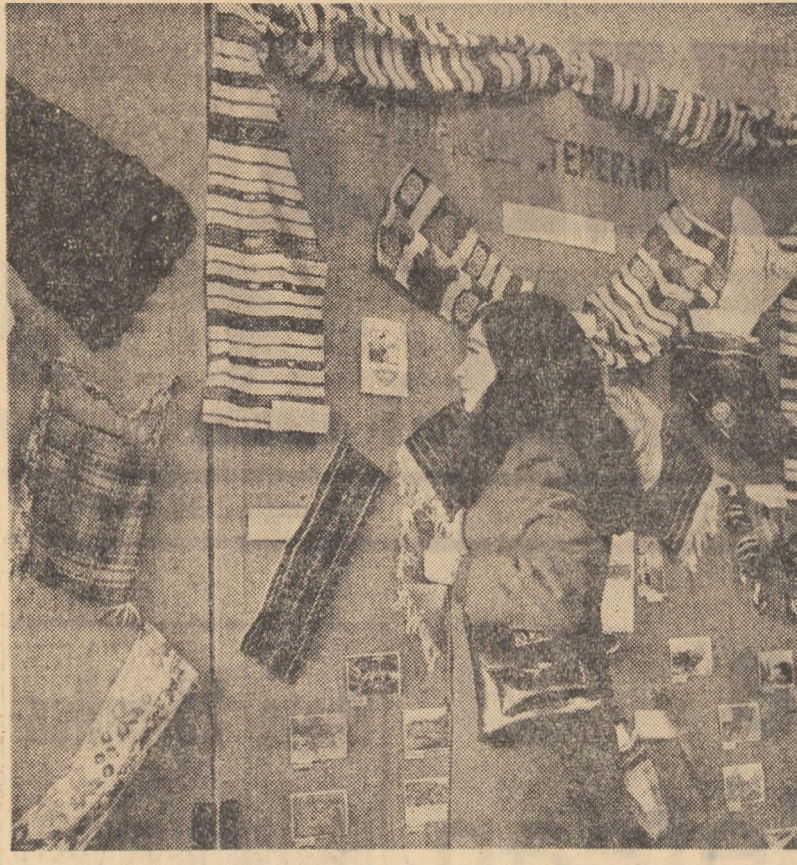
Cadru dintr-o reușită expoziție, deschisă miercuri la Casa de cultură a tineretului din Sibiu, avind ca temă expedițiile pionierești „Cutezătorii '73”

Pe lângă activitățile culturale-educative organizate în cadrul clubului este insuficientă pentru sarcinile educaționale la ora aceasta. Lipsesc aspectele, discoperiile, aparatele de proiectie etc.