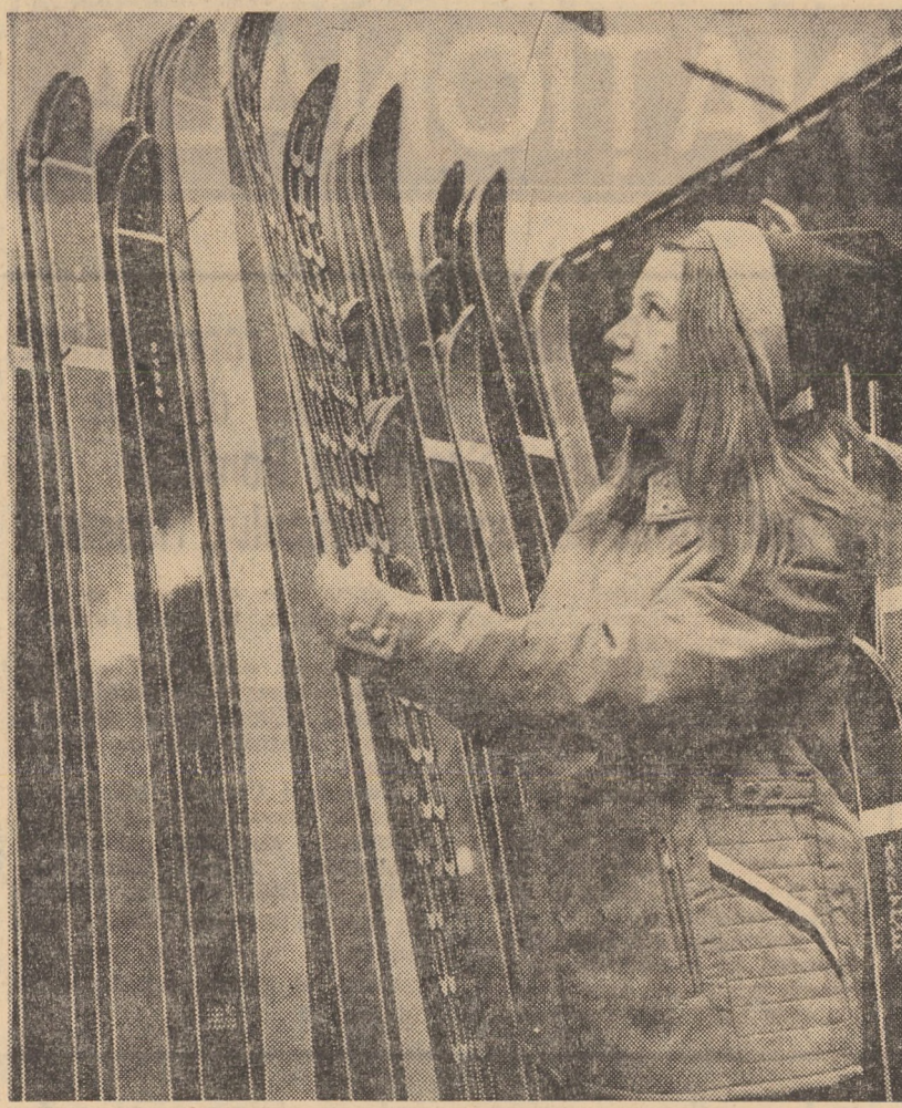
Zilele trecute, la magazinul nr. 21 „Sport”, din str. Octombrie roșu, Sibiu, au sosit importante cantități de diferite articole destinate sportului de iarnă ca: schiori de modele și mării diferite, bocanci de schi, pulovere, pantaloni din postav și material supralastic, hanorace pentru copii, femei și bărbați etc.

Desigur nu numai acestea au fost problemele discutate în cadrul conferinței. Problemele de protecția muncii, acțiunile ce trebuie întreprinse pentru activitatea educativă, de creștere a gradului de calificare etc., au fost tot atît de bine conturate în cadrul dezbaterilor.