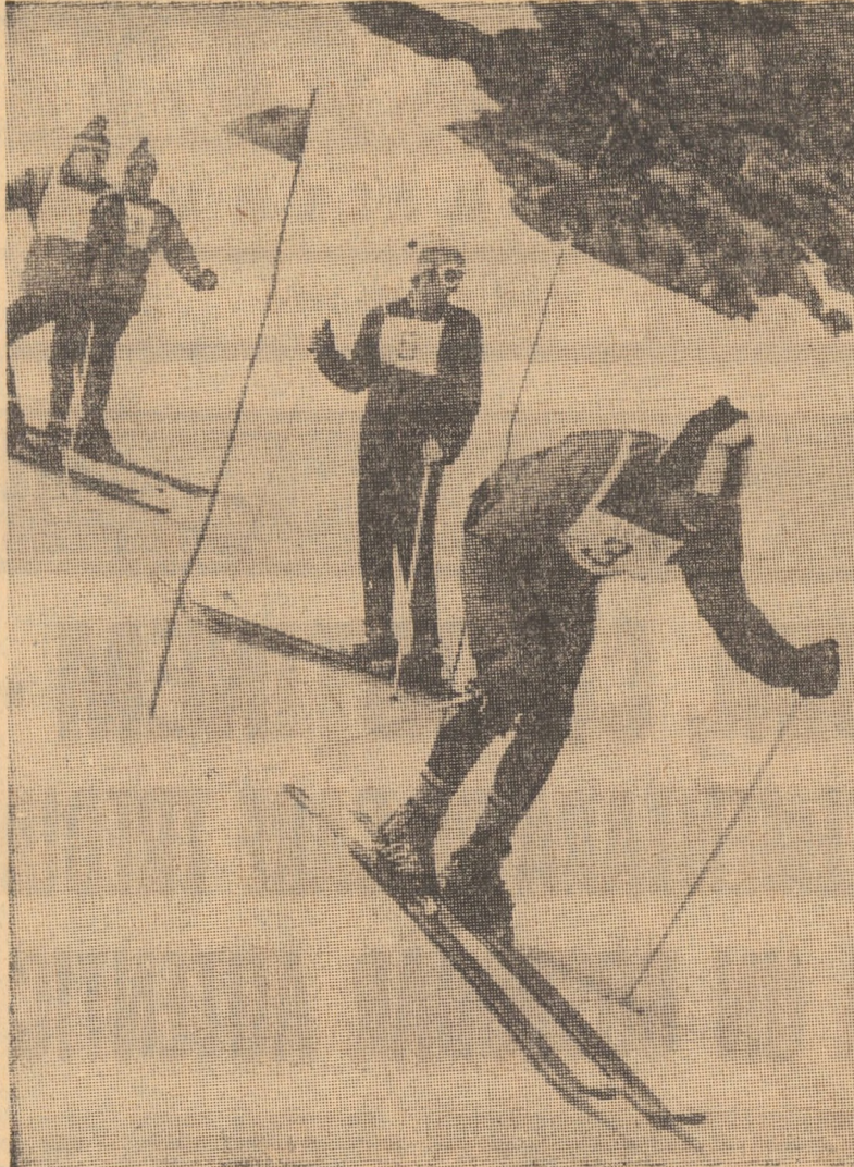
Duminică pe creasta Făgărașului