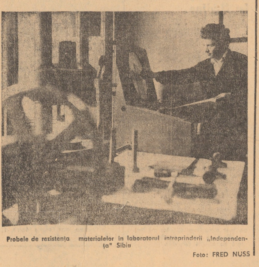
Proble de rezistență materialelor în laboratorul întreprinderii „Independența” Sibiu.

tari și producători este prezentă, în egală măsură, în colectivele de muncă ale județului și țării, indiferent de mărimea lor, că acestea sînt corolarele indispensabile ale răspunderii pe care fiecare om al muncii îl dă în cadrul întreprinderii de producție de progres economic, cultură și civilizație, adresate națiunii de conducători ei, „tovarășul Nicolae Ceaușescu.