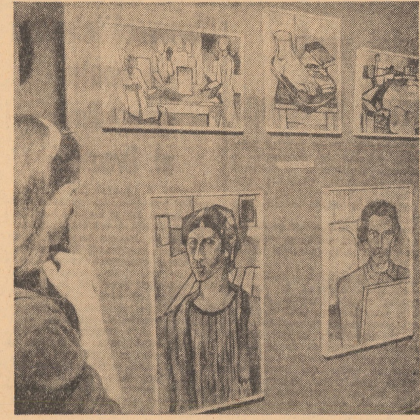
Grupaj de lucrări de pictură (alele), aparținînd elevilor Liceului de muzică și arte plastice Sibiu, într-una din interesantele lor expoziții.

color și alb-negru, ghidul prezintă colecțiile și expozițiile de bază și permanente ale Muzeului de istorie naturală.