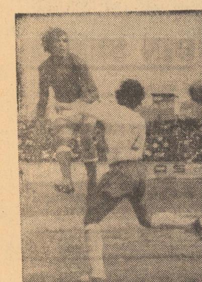
Excursie pentru meciul Nitramonia Făgăraș - F. C. Șoimii Sibiu