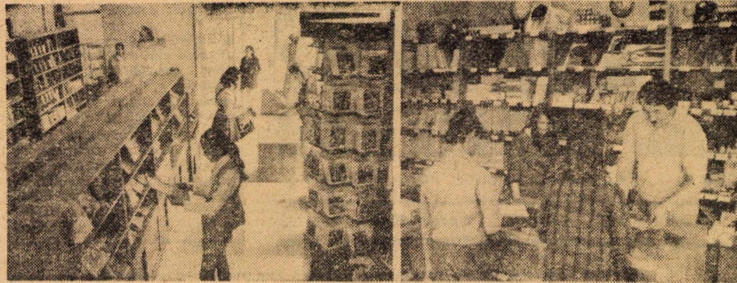
Librăria „Minerva” Hipodrom 1