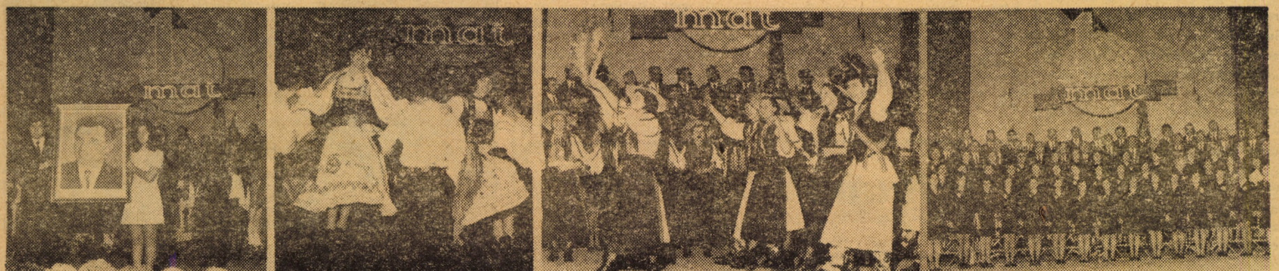
Secvențe din spectacolele prezentate la Casa de cultură a sindicatelor din Sibiu în cadrul adunării populare închinată zilei de 1 Mai