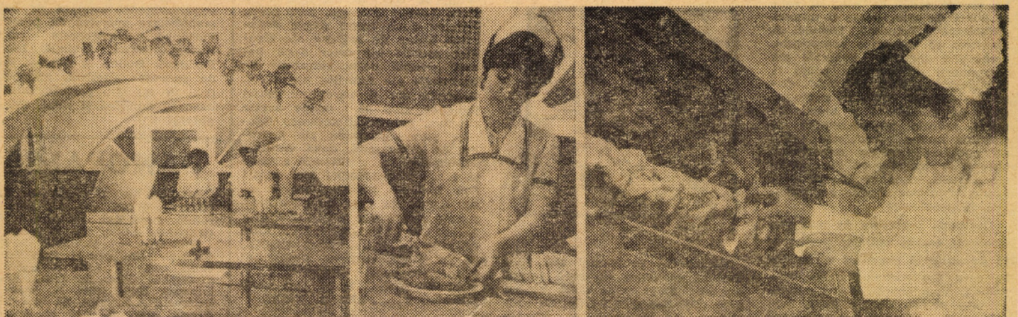
În Piața 6 Martie nr. 23, din municipiul Sibiu, s-a inaugurat zilele trecute o nouă rotiserie.

CAIUS CONSTANTINESCU — consilier juridic —