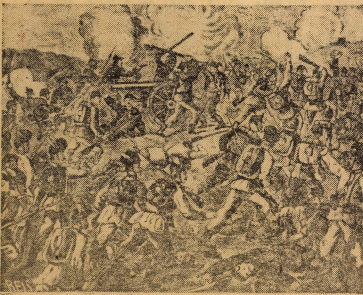
Asalt asupra redutei Grivița (Gravură)