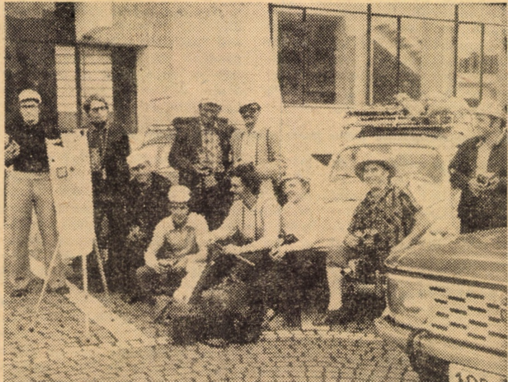
În zorii zilei de 21 august a.c., un grup alcătuit din membri ai fotoclubului „ORIZONT” din Sibiu a plecat într-o expediție fotografică în mai multe localități din Delta Dunării pe timp de 10 zile. Materialul înregistrat pe pelicula fotografică va alcătui tematica unei ample expoziții de fotografii artistice care va fi prezentat publicului sibian într-un viitor apropiat

• Profesoară tinăra caut în Sibiu de la 1 septembrie cameră mobilată. Informații telefon 712 34 între orele 8-10.