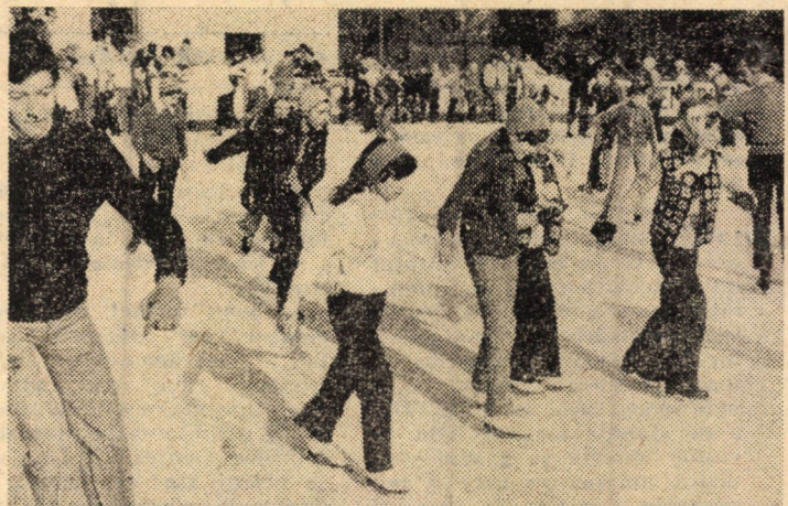
Invitație la patinoarul artificial

În ambele competiții, primele două clasate din fiecare grupă se califică pentru semifinale.