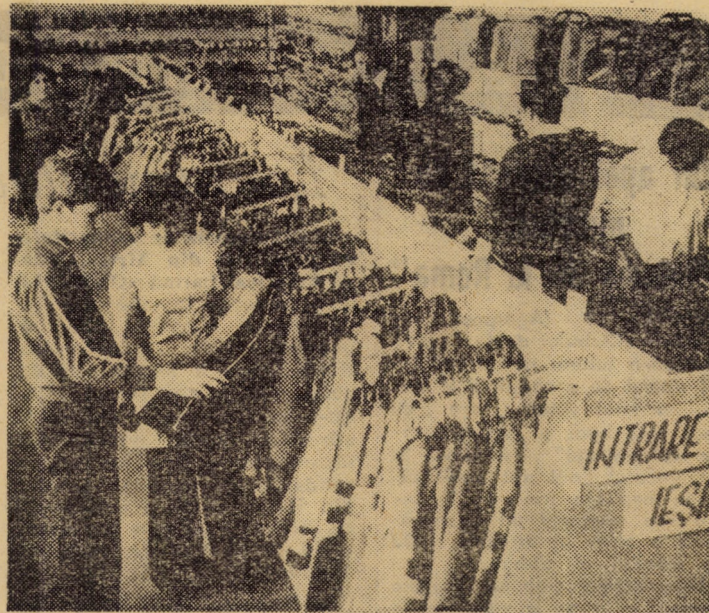
Mergind pe linia modernizării comerțului, I.C.S. Mărfuri industriale a organizat nu de mult, în cadrul unității nr. 121 „Sportul din Sibiu, un raion cu autoservire, care cuprinde textile-încălziminte, sporind în felul acesta modul de expunere a mărfurilor, contribuind la mai buna servire a populației

În interesul economiei naționale, al bunăstării noastre!