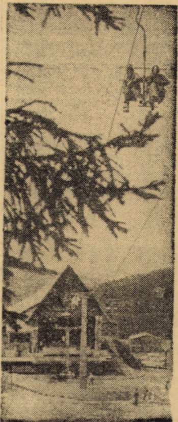
Păltiniș — în plin sezon estival

Astăzi, pe terasa Casei de cultură a sindicatelor din Sibiu are loc de la ora 17,30 un concert de fanfară.