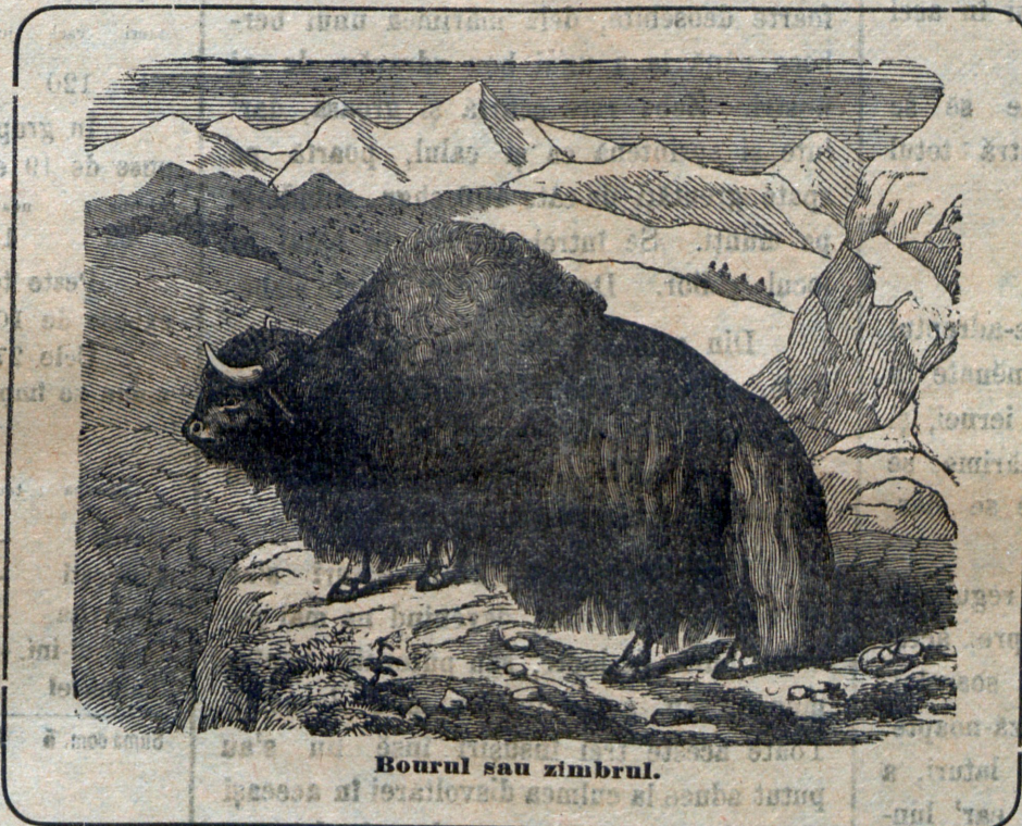
Bourul sau zimbrul.

Cu vremea însă în Carpați s'a tot împuținat și s'a stîrpit de tot, cum și în alte părți ale Europei. În Ardeal cel din urmă bour a fost pușcat la 1762 în pădurile Bărgăului. De atunci pe la noi nu s'a mai văzut. Astăzi se află numai în Canez și în Lituania (Rusia, în pădurea împărătească dela Bjelovjeș). Aici e oprit a-l vâna, voinde astfel guvernul rusesc ca să nu se stîrpească cu totul, ci de nou să se sporească.