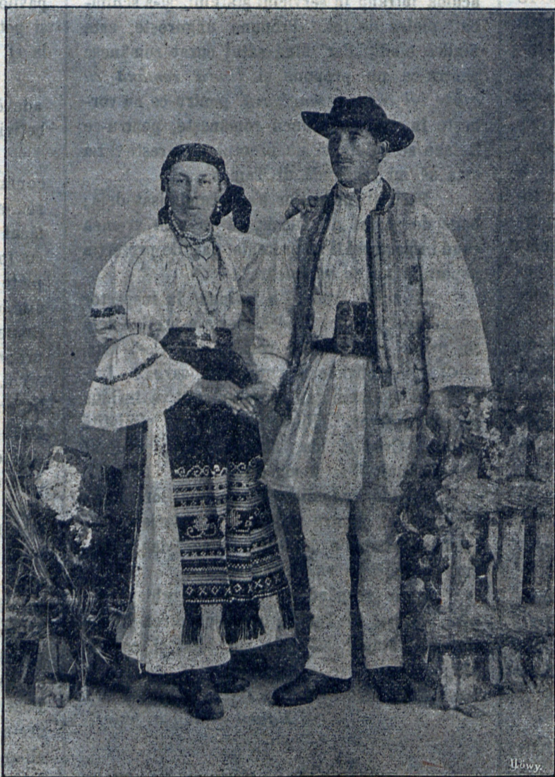
Țărani români din Șoimuș.

Înainte de fătare să 'i-se dea atențiune (băgare de seamă) ugerului. Până-când ugerul e moale și la tras nu curge de loc lapte din țite, nu este de lipsă o tractare deosebită a aceluia; îndată-ce ugerul devine mai tare și laptele se slo-