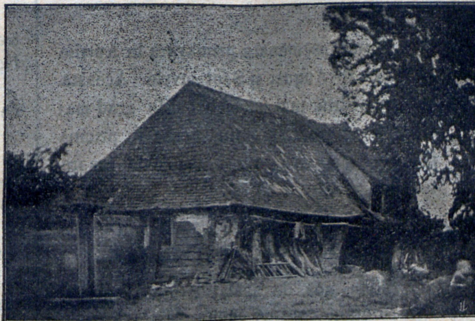
Casa natală a lui Andreiu Murășan.

Ilustrația, ce o dăm azi, privește leagănul, pruncia lui Andreiu Murășan. Este chipul casei în care s'a născut marele poet, la 16 Noemvrie 1816. În această casă săracă și modestă a stat leagănul aceluia, care mai târziu prin puterea talentului său a îmbogătit literatura română cu „Deșteaptă-te Române din somnul cel de moarte” și alte mărgăritare ale poeziei române.