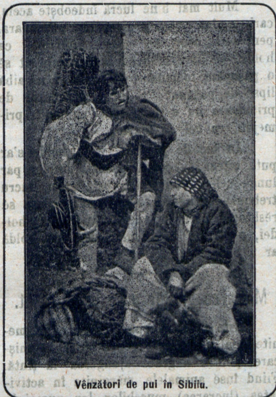
Vînzători de pui în Sibiu.

Păstrarea în pivniță este negreșit cea mai sigură și mai îndemnată, presupunînd însă că aceasta este uscată, în destul pe afundă și provăzută cu mijloace de aerisare. Avînd un castan gol pentru straturile calde, iernarea legumelor se poate face în mod foarte ușor. Castanul se provide cu un înveliș de franze, asigurându-se în contra pîtrunderii gerului prin ferestre și coperiș. Fără acoperire în liber se țin: salata de iarnă, salata de câmp, spinacul de iarnă, pîtrânjeii ș. a.