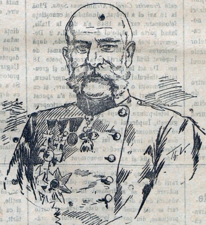
Francisc Iosif I.

acest termen al vremii, atât de însemnat în viața Domnitorului nostru, venim a ne exprima cu sinceritate dorința inimii, ca D-zeu să fie în deplină sănătate pe iubitul nostru Domnitor, Francisc Iosif I. în un șir lung de ani, ca să poată vedea îndestulit și fericit și pe credinciosul poporul seu român, după-cum știm, că El o dorește.