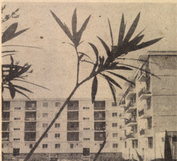
Din peisajul tînărului cartier de locuințe din Calea Dumbrăvii, Sibiu