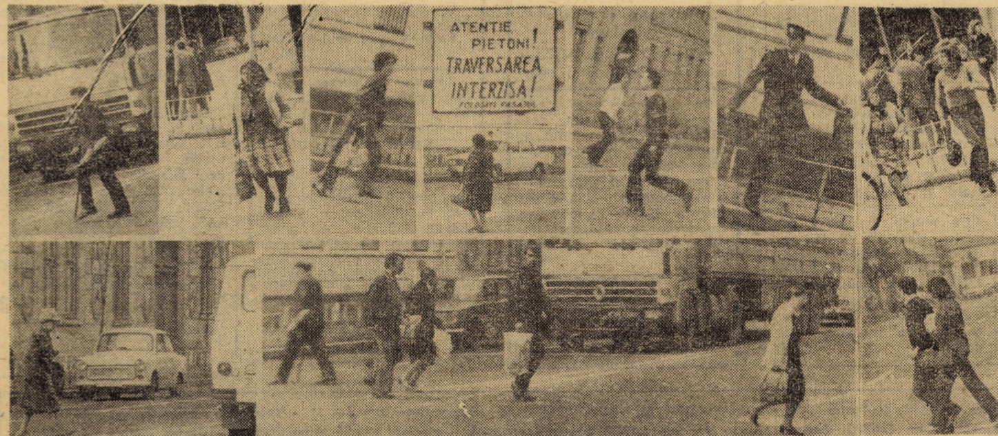
Priviți aceste imagini! Ele au fost surprinse, joi, 1 octombrie 1981, în intersecția străzilor Lenin — B-dul Victoriei din Sibiu. În loc să folosească pasajul subteran, zeci și zeci de pietoni își riscă viața făcînd slalom printre mașini.