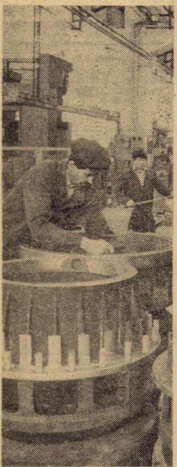
Una dintre operațiunile cheie în fluxul tehnologic al autobasculantelor la întreprinderea mecanică Mirșă o reprezentă montarea punților motoare căreia i se acordă o atenție cu totul deosebită

— Avem speranța că da. În acest sens, s-a hotărît organizarea, de către I.J.G.C.L., în fiecare localitate a unor echipe specializate care vor executa lucrări de îmbunătățire a hidroizolațiilor pe baza unor soluții constructive noi și tehnologii de execuție complementare, care au în vedere aplicarea peste stratul de hidroizolație a unor materiale de protecție eficiente împotriva radiațiilor solare și a precipitațiilor. Totodată, întreprinderea specializată și I.C.M.J. au demarat lucrările pentru eliminarea fenomenului de condens. În plus, I.J.G.C.L. va constitui, pînă la finele anului, echipe de instalatori în toate localitățile pentru prestări servicii, reparații a instalațiilor interioare, încheind în acest sens contracte ferme cu asociațiile de locatari pentru verificarea periodică a stării imobilelor și executarea reparațiilor de intervenții la instalații. O atenție deosebită va fi acordată lucrărilor de modernizare la bazele de producție din Sibiu și Cîsnădie, cu termen de finalizare în 1982 și la cele din Medias și Coșca Mică, ce vor fi încheiate în 1983, urmînd ca pînă la sfîrșitul cincinalului să se asigure, în toate localitățile urbane, dotarea necesară creșterii prestărilor în construcții la un ritm mediu de 15 la sută, în condiții de mecanizare, prefabricare și eficiență economică la nivelul sarcinilor prevăzute în actualul plan cincinal.