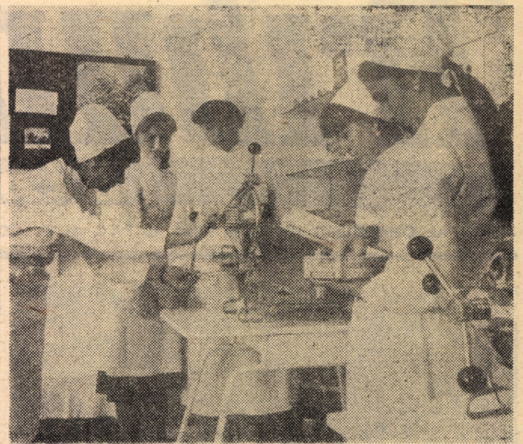
Prima perioadă de pregătire și practică profesională a viitoarelor surori medicale, în prezent eleve ale Liceului sanitar Sibiu, se desfășoară în săli de demonstrații, dotate cu mobilier și aparatură adecvată precum și cu un bogat material didactic.