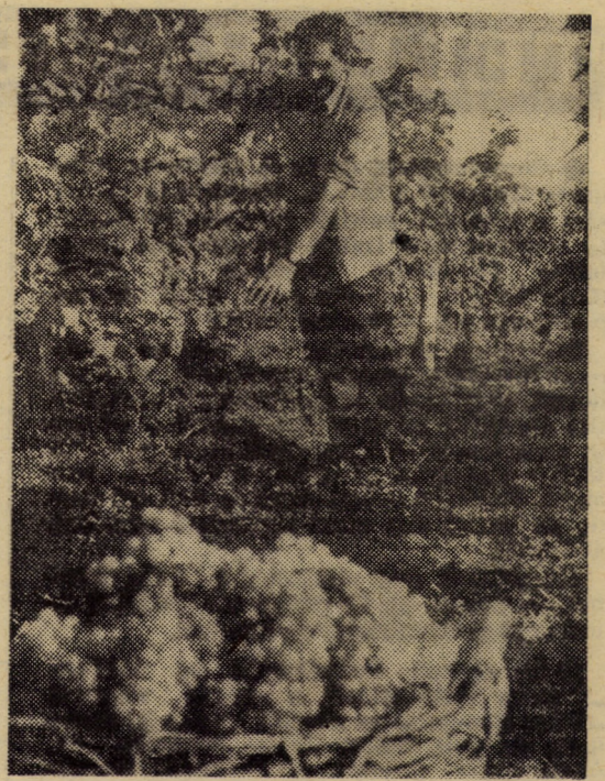
Cules de struguri la I.A.S. Apoldu de Sus