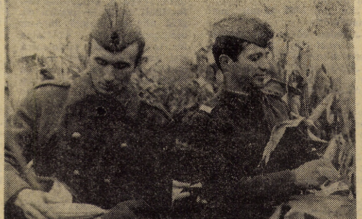
Alături de lucrătorii ogoarelor, elevii Școlii militare „Nicolae Bălcescu” din Sibiu participă cu bune rezultate la recoltarea porumbului.