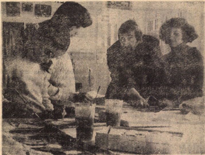
Inițierea celor mici la cercul de design al Casei pionierilor din Sibiu